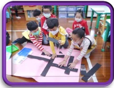
設計我們的 彩虹商店街道