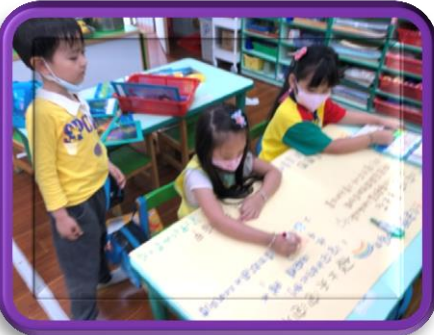
把每個市集老闆的 工作內容記錄下來