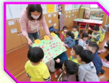
檢視菜市場商品 是否正確分類