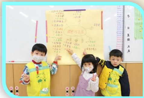
團討經驗圖表~ 商店的種類