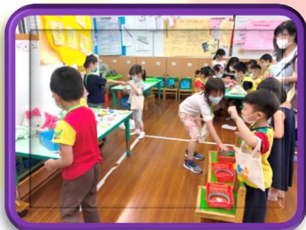
套圈圈市集 是我們最熱銷的！