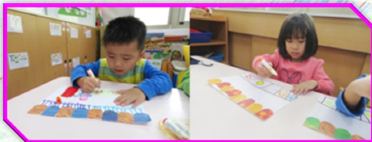
找出廣告單上想買的物品