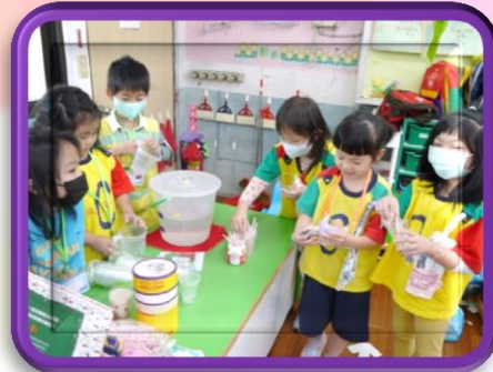
試做泡泡水 找出完美比例