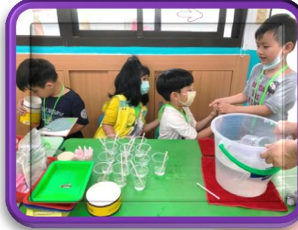
泡泡水市集 也是各司其職