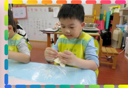
來開麵包店- 我會製作麵包、 塑型及烘烤