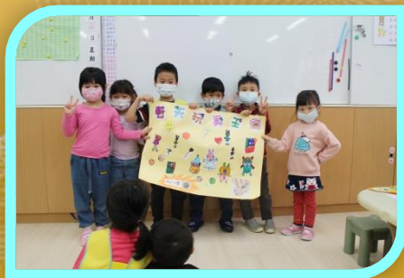
設計開店宣傳海報