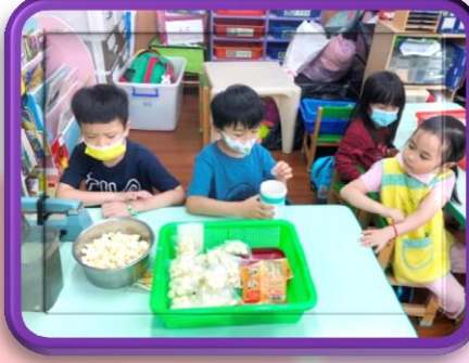
爆米花市集： 分包裝部門和銷售部門