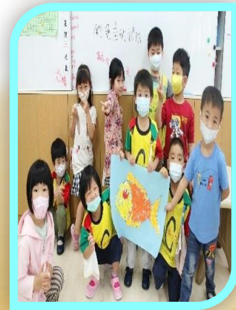
大家一起製作 商店的招牌