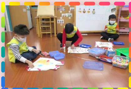
商店街活動準備- 店員服裝製作