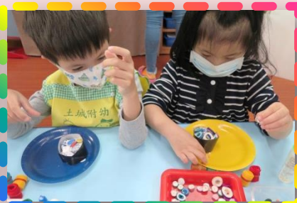
來開壽司店- 捲一捲、貼一貼 完成壽司拼盤