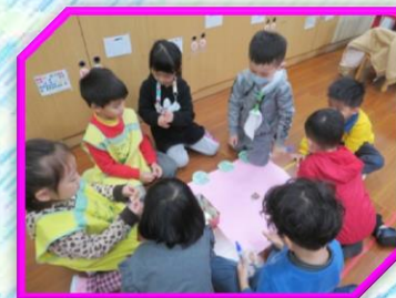
小組合作商品分類