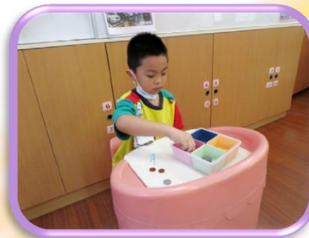
大家來做商店海報