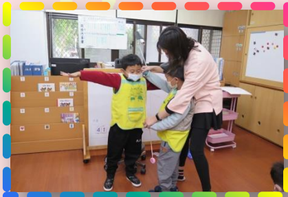
來開裁縫店- 我是小小裁縫師