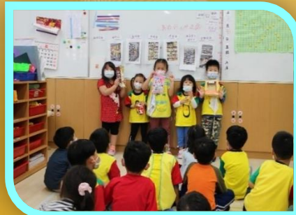
商品多多任您挑選