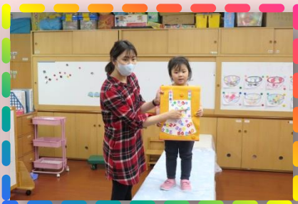
來開裁縫店- 我會設計衣服，參加服裝設計發表會