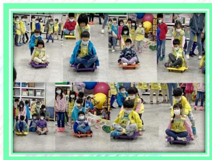
體能館試營運- 滑板車