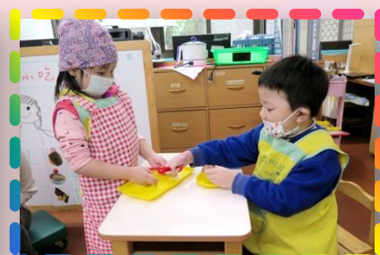
來開小吃店- 我是優秀的小吃店店員