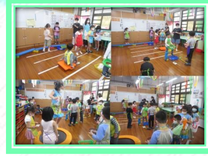
星星體能館開店囉!