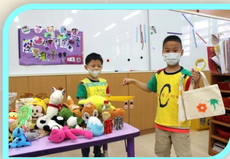
模擬開店~ 二手玩具店