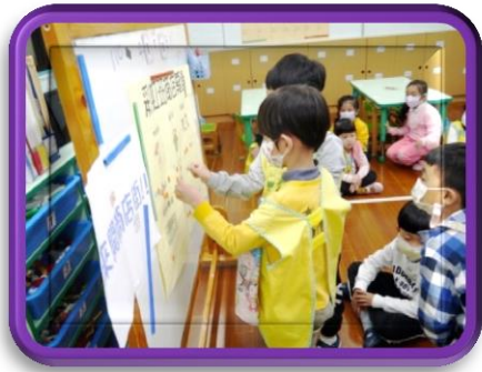
票選出彩虹市集商店