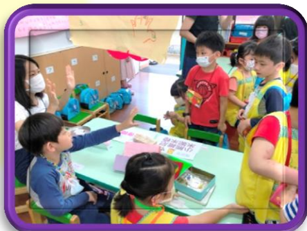
美甲市集： 幫客人彩繪指甲