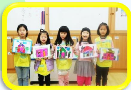
分享我最喜歡的商店