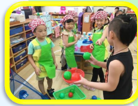
大家來開店-老闆組