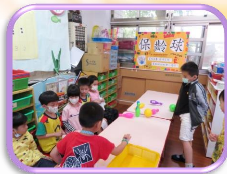
月亮遊戲屋- 保齡球遊戲