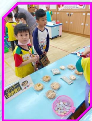
商店街活動-- 我是小客人