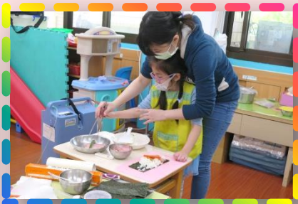
來開壽司店- 一起製作美味的 海苔壽司捲