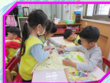
合作畫開店宣傳海報