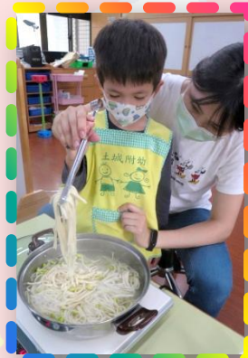
來開小吃店- 一起煮出好吃的麵