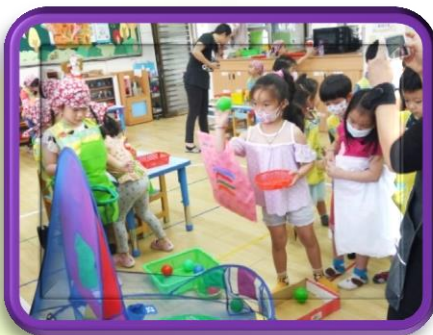
逛街真有趣 有玩有獎品