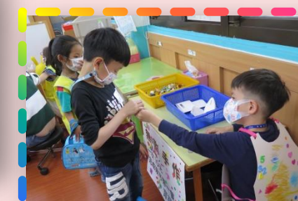
商店街活動- 白雲堡開店囉！