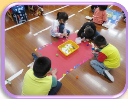
大家來做商店海報