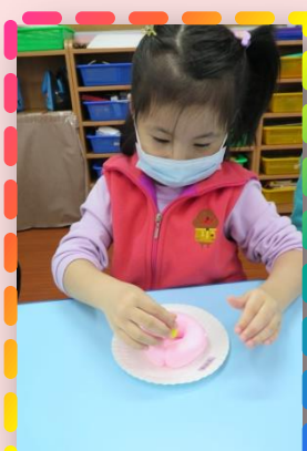
來開麵包店- 我會用黏土做麵包