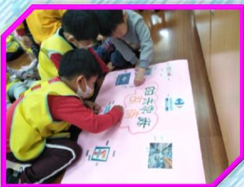
票選~我最常去的商店