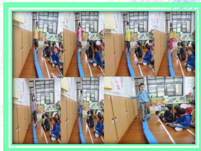
體能館試營運-- 平衡木