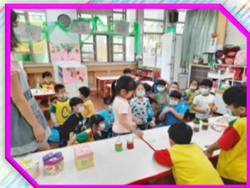
商店街活動-- 小店長介紹商品