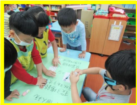
製作遊戲規則說明書