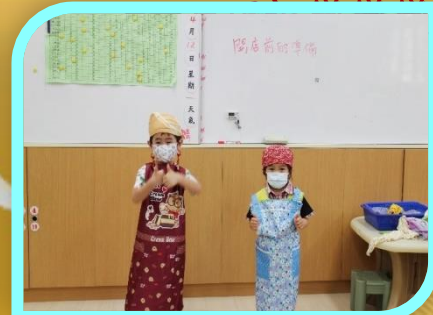
開店時店員的打扮