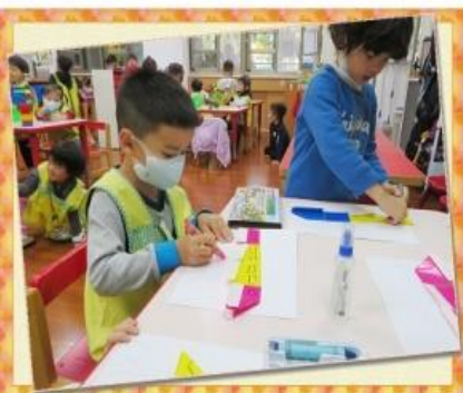
美勞-摺紙(搭高鐵旅行)