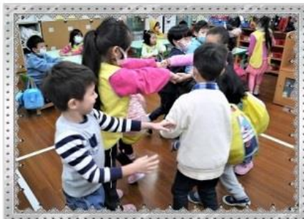
融合活動-火車快飛