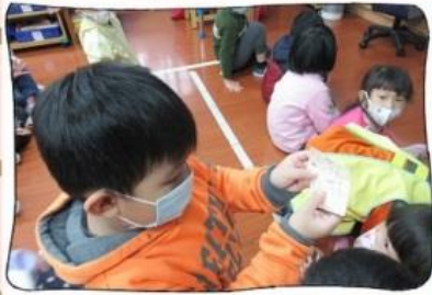
觀察台鐵和高鐵車票