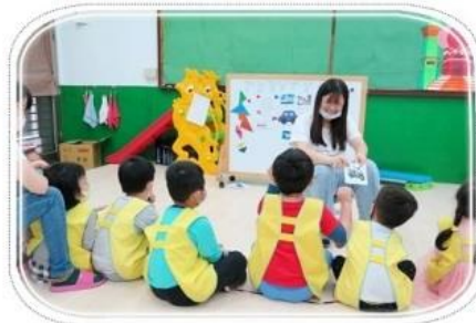
認識各種生活中常見的交通工具