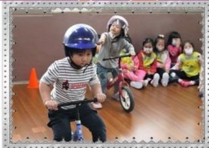
騎乘機車記得 戴安全帽