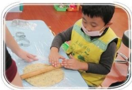
我會做好吃的餅乾！