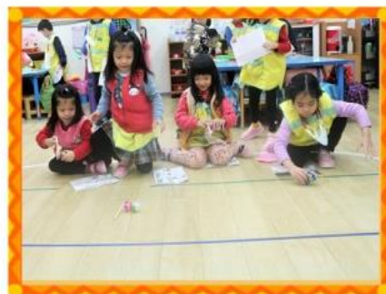
交通工具闖關活動