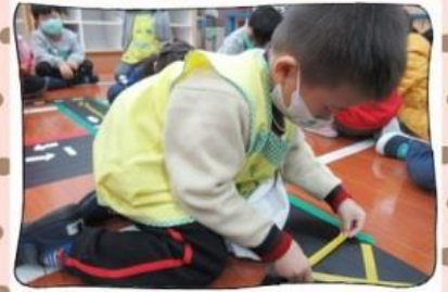
我在貼黃色網狀線哦