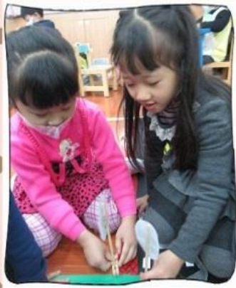
~討論趣~這個路口應該要放什麼交通標誌呢?