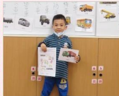
我最喜歡的交通工具