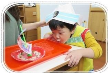
扮演遊戲-小船長開船囉！