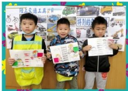
特別的交通工具- 外送員