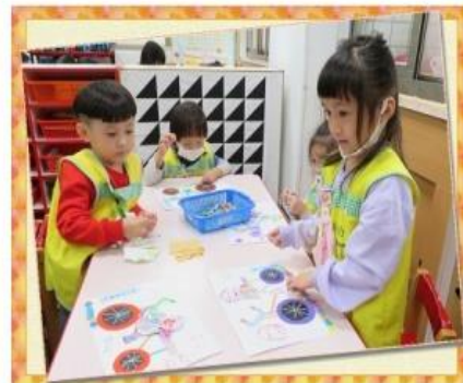
美勞~猴山仔騎鐵馬