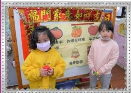
節慶活動一 吉祥話大挑戰