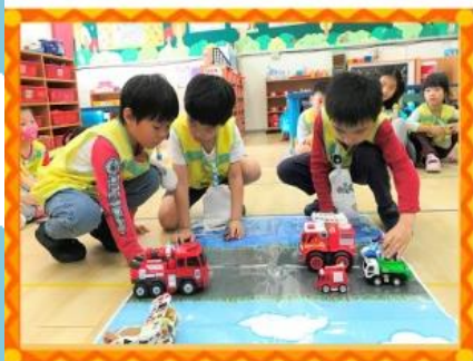
我喜歡的交通工具 在海陸空哪？