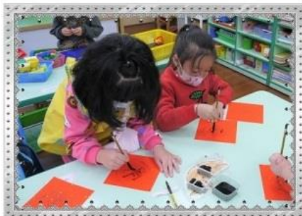
節慶活動-小小書法家