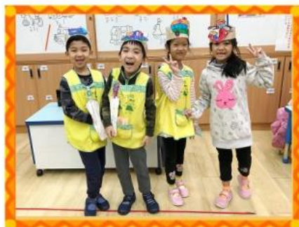
製作我的交通 工具頭套