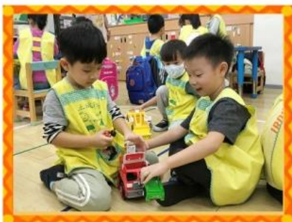
交通工具-分享時間