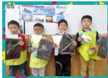
手電筒尋找紅綠燈