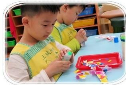
利用色紙和玻璃紙裝飾小飛機