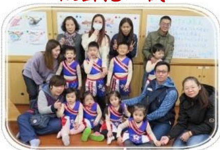
運動會表演-穿上漂亮的表演服和家人一起拍照