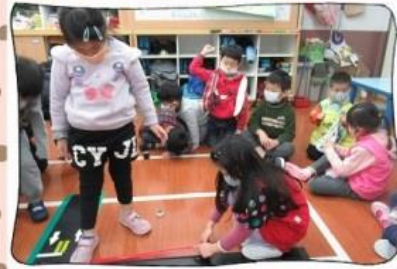
合作貼出陸上交通路線