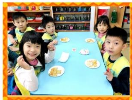
拼湊交通工具-餅乾