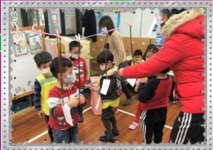
陸海空交通工具分類