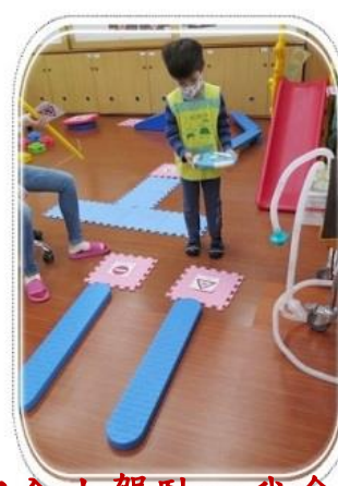
我是安全小駕駛，我會注意紅綠燈及交通號誌