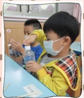
自製寶特瓶動力船