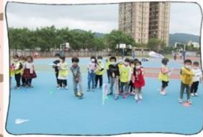
咻~飛好遠的紙飛機呀