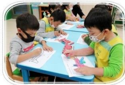
認識飛機的構造，並將這些構造塗上顏色