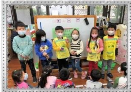
交通工具兒歌節 奏樂器表演