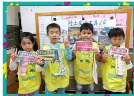
我自己設計的公車