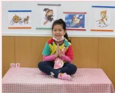
想像的交通工具- 阿拉丁的魔毯