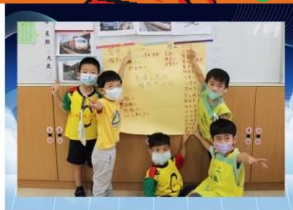
團討~交通工具的 種類與功能