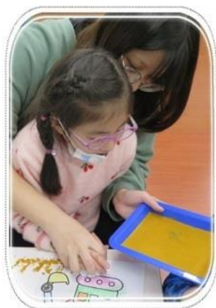
用紙團蓋印 做出挖土機