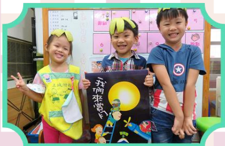
中秋慶團圓~ 帶柚子帽