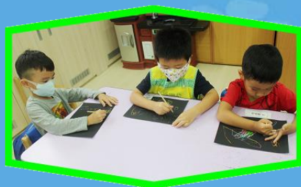
刮畫體驗~ 國慶煙火