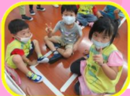
三原色小精靈對對碰