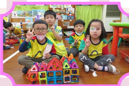
利用形狀磁力積木 進行團體創作