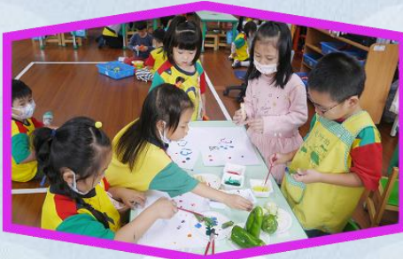
形形色色的蔬果 各形各樣的形狀