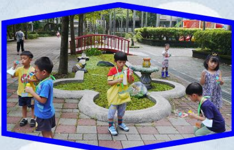
當我們同在一班- 開學週