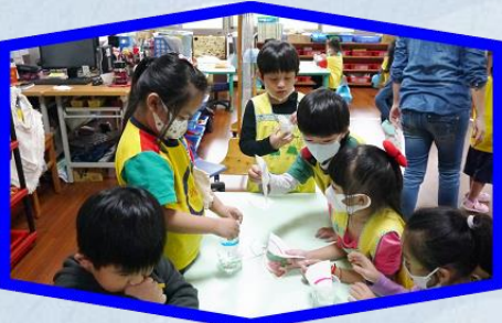
動手作實驗真有趣- 色相分析