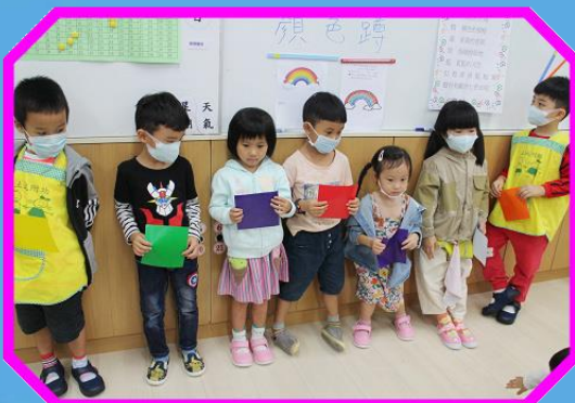
我會玩「顏色蹲」遊戲