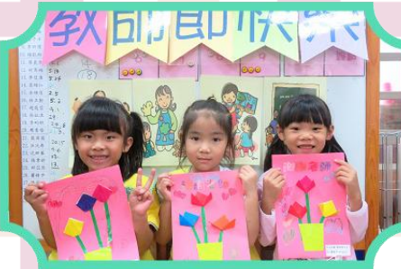
教師節製作美麗的 教師節卡片