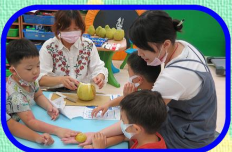
節慶活動-認識 中秋節、吃柚子 、帶柚帽