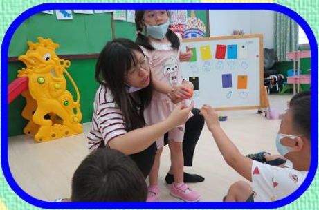
認識顏色、 生活中的顏色