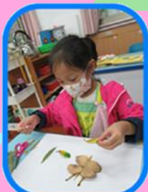
~大自然的顏色~ 葉子黏貼創意畫