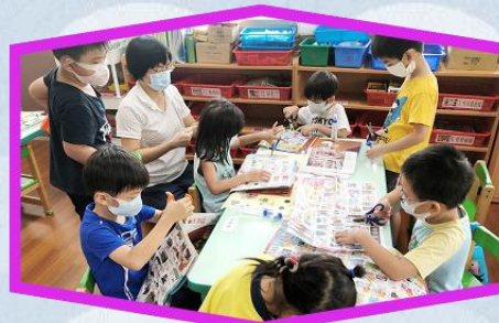
找不同形狀做分類