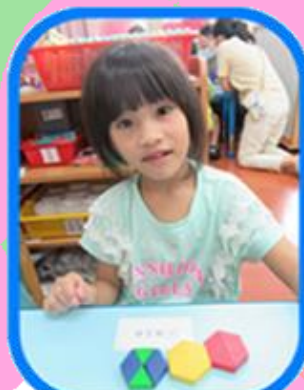
認識更多不同的形狀