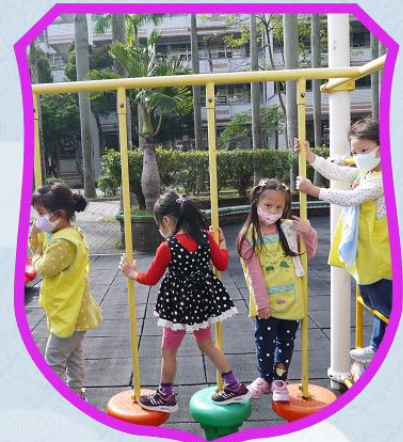
遊樂場是我們的心頭好