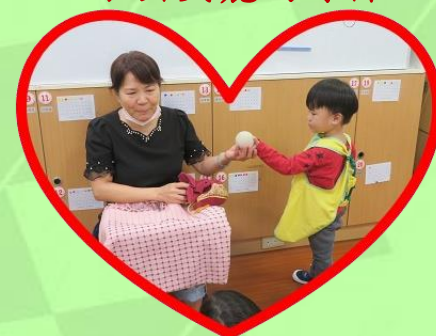
摸摸看神秘袋裡 有什麼