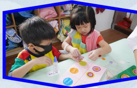
我愛故我們在 -融合活動