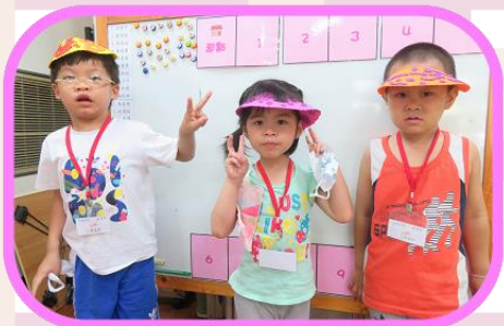
利用彩色泡棉 進行帽子創作