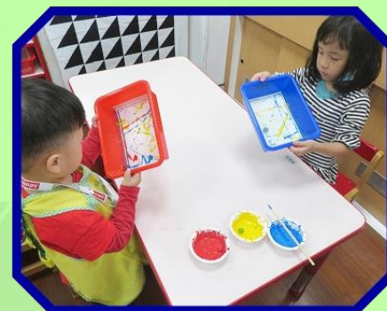
滾！滾！滾！ 滾出美麗的線條