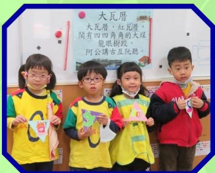
三角形變變變， 變成小旗幟