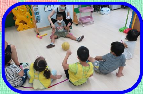
新學期的開始, 認識新同學