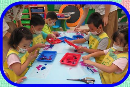
節慶活動- 國慶日國旗美勞