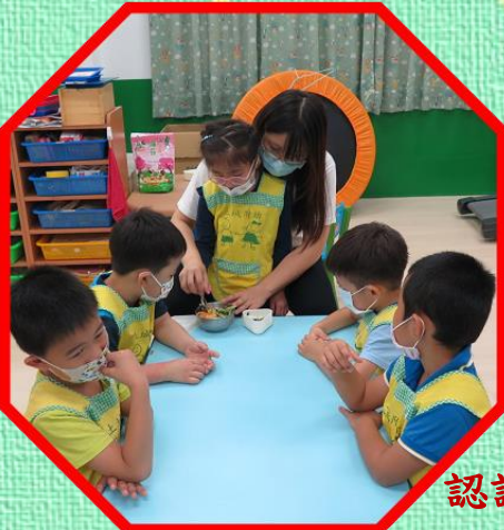
認識形狀、製作三角飯糰