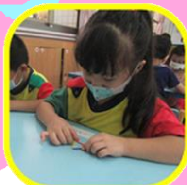
認識形狀的邊與角