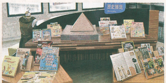
▲書展的歷史寶盒區。