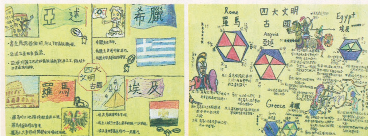
▲學生整理的四大文明古國海報。