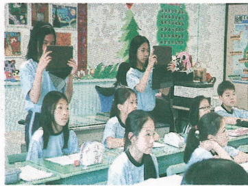
▲用平板電腦記錄採訪過程。

到了採訪當天，學生逐一提問並嘗試運用平板電腦攝影。學生的提問相當多元：「為什麼會擔任世界展望會的志工？」「工作中是否有