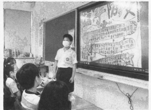
班級交流分享報告內容，開放同學提問。