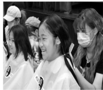
北市再興小學與「癌症希望基金會」合作，讓全校有意願的孩子，剪下健康髮束以響應捐髮，關懷癌症病友。