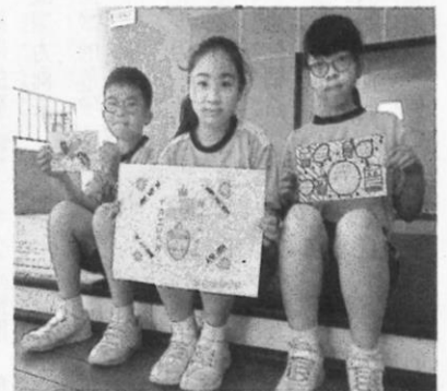
口罩套圖樣，展現學生設計巧思。

案，讚揚臺灣出色的防疫表現。小朋友親自把卡片寄到各防疫單位，也親手送到社區藥局、診所，表達謝意。孩子在專題報告中寫：「臺灣能夠很多天零確診，是各單位合作防疫的成果，國人都遵守防疫規定、照顧好自己才能做到。我發現：臺灣人不只友善，努力照顧自己又樂於助人，才有今天各國的肯定。」這段話為課程做了很棒的結論。