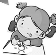
藝術與人文領域(美勞)： 一起看展覽 一起來畫畫