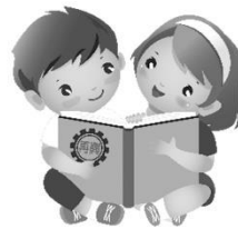
語文領域(閱讀)：閱讀興識界