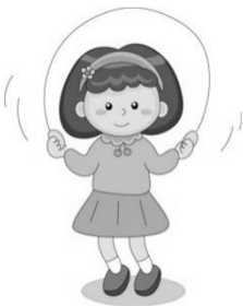
健康與體育領域(體育)： 歡樂一起跳