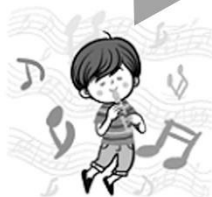
藝術與人文領域(音樂)： 風趣玩味~福佬語