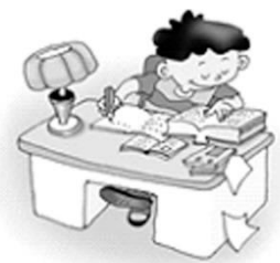
社會領域：寫給自己的信