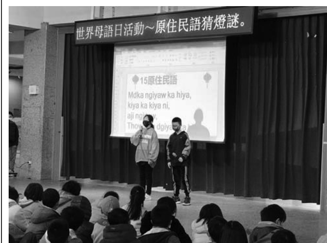
生命教育-尊重多元文化,欣賞彼此間的不一樣。