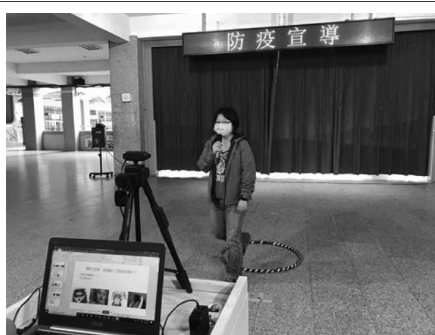
生命教育-疫情期間,進行全校心理健康宣導。