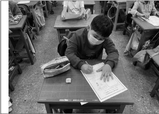
說明：專注寫學習單。