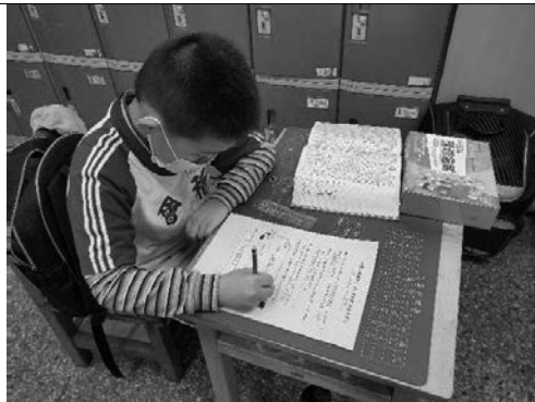
說明：認真用字典查字並完成學習單。