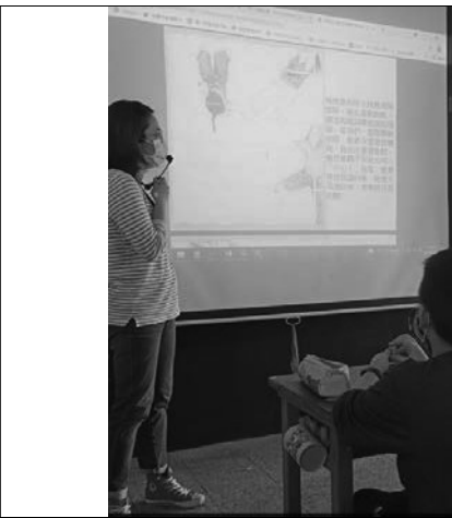
說明：老師講解繪本內容。