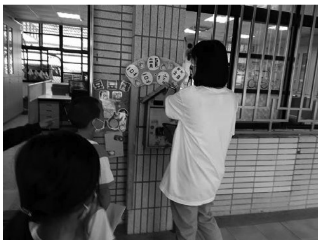
111 學年度開學之初，專輔老師帶領一年級新生認識輔導室，介紹「豆豆龍信箱」在小朋友有心事時可以有個宣洩傾訴的管道。