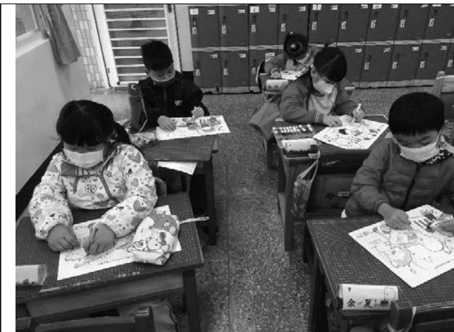
說明：一起用非慣用手畫圖。