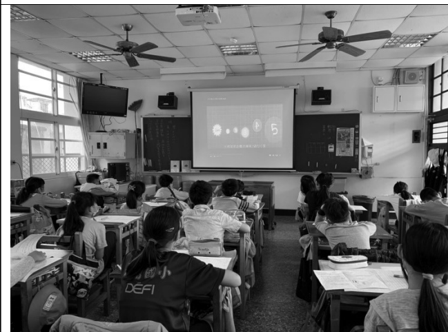
說明：觀看心中的小星星。