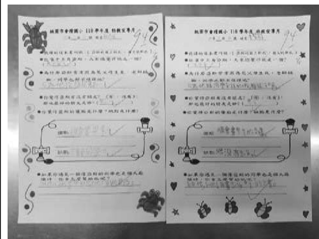
說明：學習單成果展示。