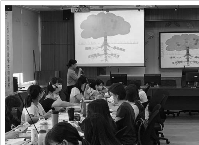
生命教育-心理健康議題討論,擁有健康的身心才更有力量幫助他人。