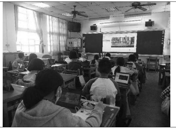
說明：自主學習並完成學習單。