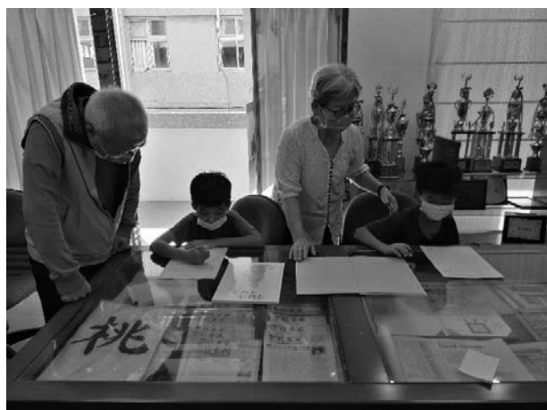
照片說明：祖孫情夏令營共學趣活動