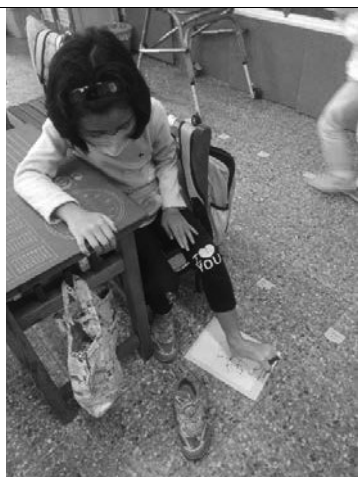
說明：體驗用腳趾頭練習寫字。