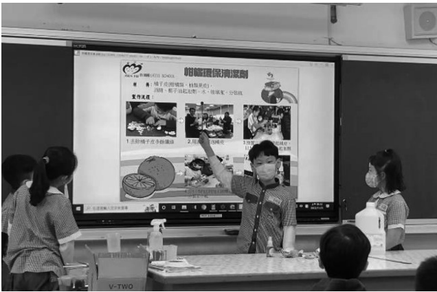
愛環境-製作橘皮清潔劑，無毒永續家園