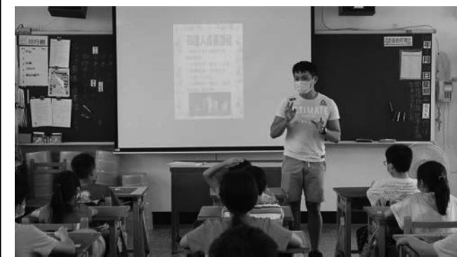
照片說明：專輔老師情感教育-認識情感、接納自我。