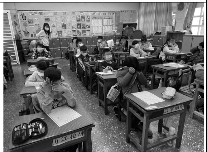
說明：大家一起遮眼體驗寫學習單。