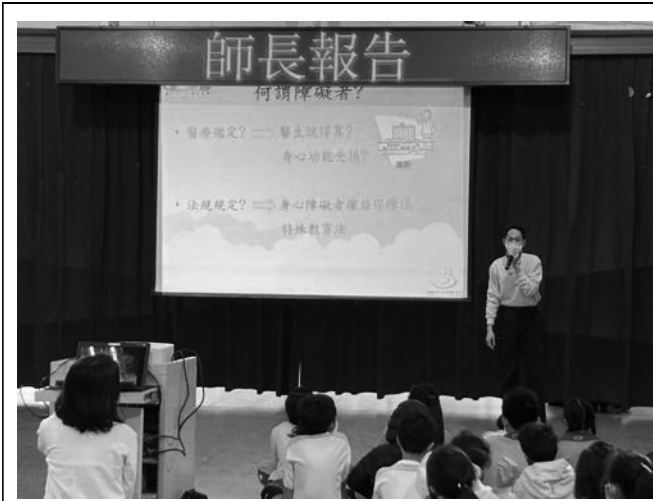
愛別人-身心障礙特教宣導，增加學生及特殊學生彼此的了解與互動，建立無障礙的人文環境。