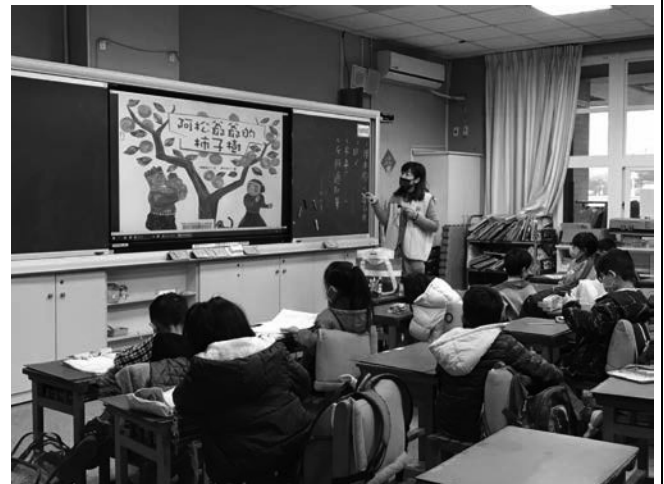
愛自己-晨光志工進行生命教育繪本故事活動，教導學生進行自我探索。