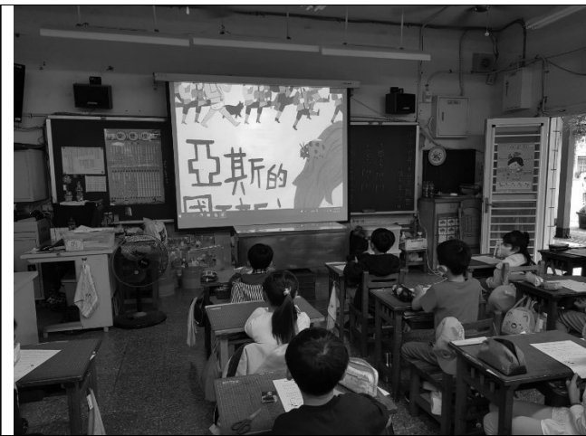
說明：邊看繪本邊寫學習單。