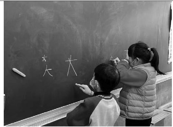
說明：體驗視障者寫字的不方便。