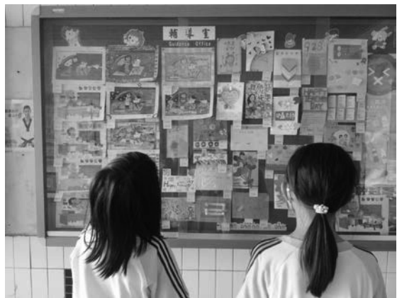
照片說明：教師節尊重與感恩優秀教師卡展示