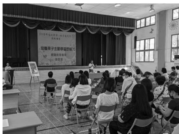
111 學年度親職教育講座，特邀黃登漢校長蒞校演講主題為「培養孩子主動學習的能力」，黃登漢校長與家長分享在親職教養上的方法，快樂的學習事半功倍，孩子自動自發，化被動為主動，陪著孩子成長一起學習快樂。