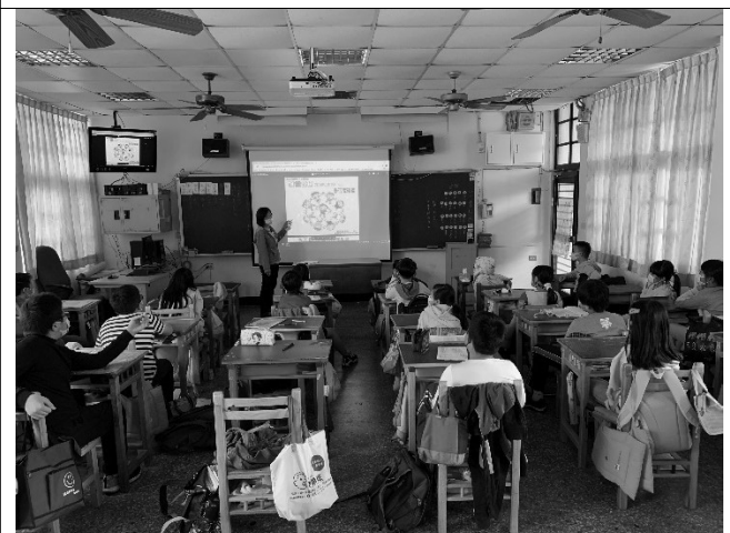
說明：教師說明何謂學習障礙。