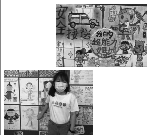
愛別人-肯定家人對自己的愛與付出