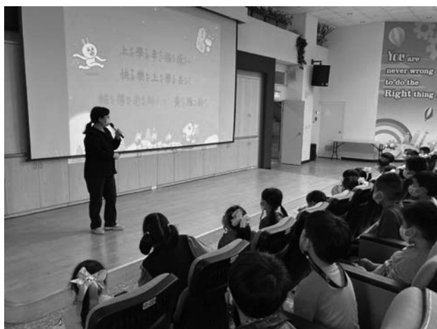
愛自己-專輔教師宣導生命教育，肯定自己，找到上學幸福感。