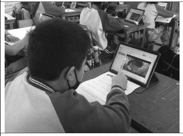
說明：邊觀看影片邊寫學習單。