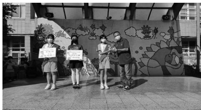
照片說明：教師節敬師小語活動