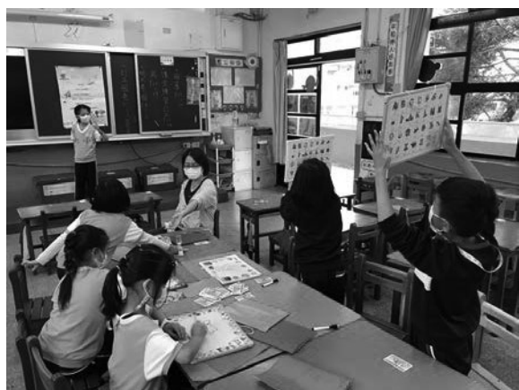
111 學年度小團體活動《舞動自信:人際關係成長團體》，由二年級導師擔任 Leader，帶領二年級學生以小組討論、團體遊戲、繪本與影片分享、桌遊等方式進行生命教育中自我情緒的覺察與辨識，學習在團體中與同儕相處。