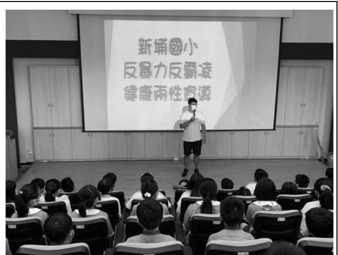
愛別人-反霸凌宣導，尊重他人、對自己的行為負責。尊重他人，拒絕成為受害者，不要變成加害者。