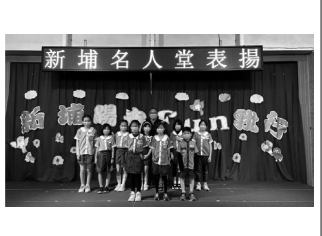
愛別人-名人堂表揚優秀表現學生，正向肯定他人優點。