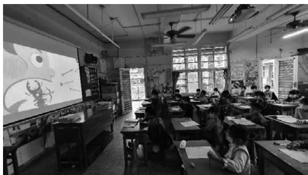
說明：邊看繪本邊寫學習單。