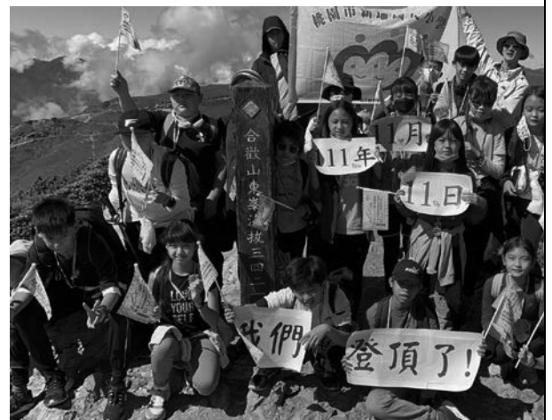
愛環境-山野課程，親近自然，認識自我；關心生態，愛護環境；珍惜擁有的生活。