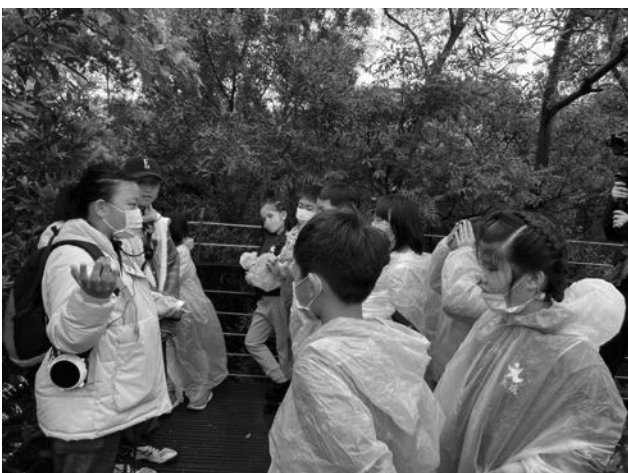
愛環境-虎頭山植物導覽課程，關心生態，愛護環境；珍惜擁有的生活。