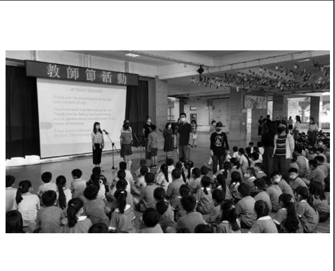
愛別人-求學生涯中的愛與陪伴