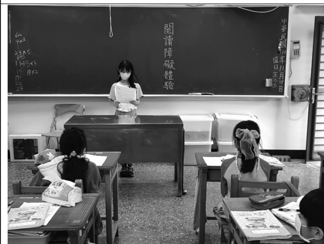
說明：讓學生體驗閱讀障礙。