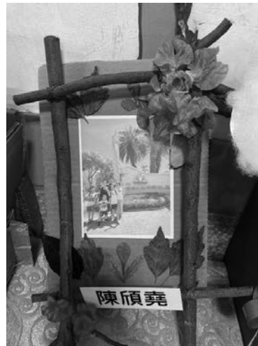
愛環境-利用校園自然物進行環境布置