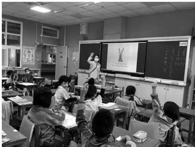
愛自己-晨光志工進行生命教育繪本故事活動，教導學生保護自己。