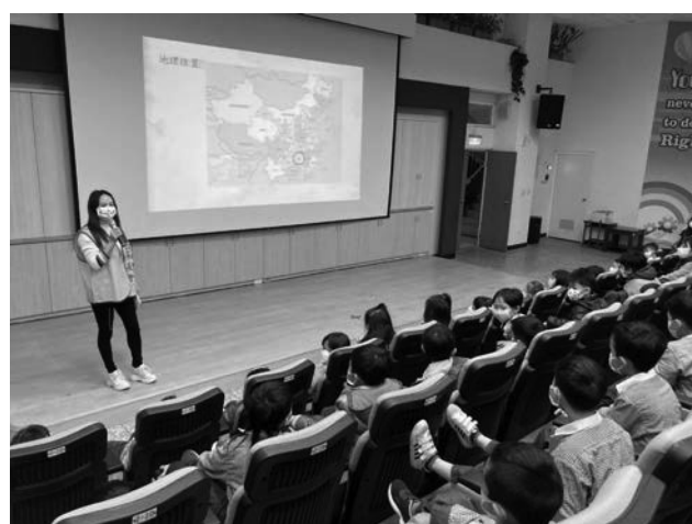
生命教育-多元文化分享,尊重多元,欣賞多元,感恩多元。