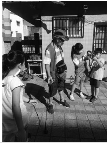
愛環境-珍惜資源課程，學習查漏水方式，不浪費水資源。