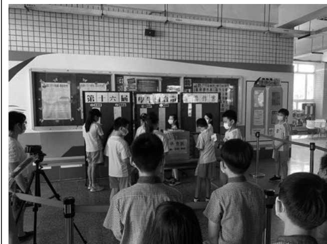
愛別人-品德楷模，自治市市長、模範生選拔楷模學習