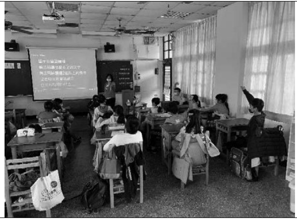
說明：請學生發表意見。