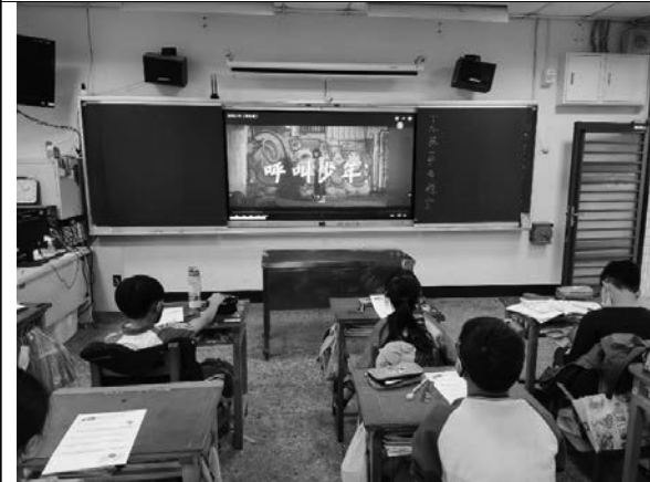
說明：觀看呼叫少年微電影。