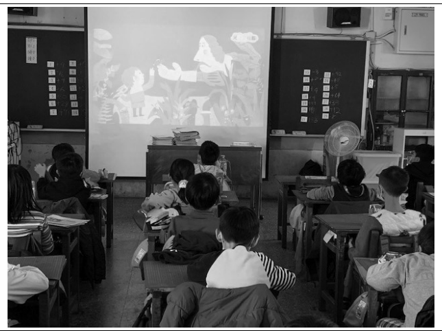
說明：大家都投入看繪本。