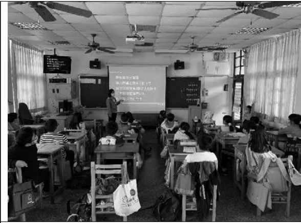
說明：教師說明何謂學習障礙。