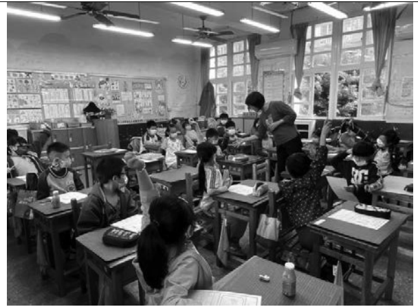
說明：教師指導學生寫學習單。