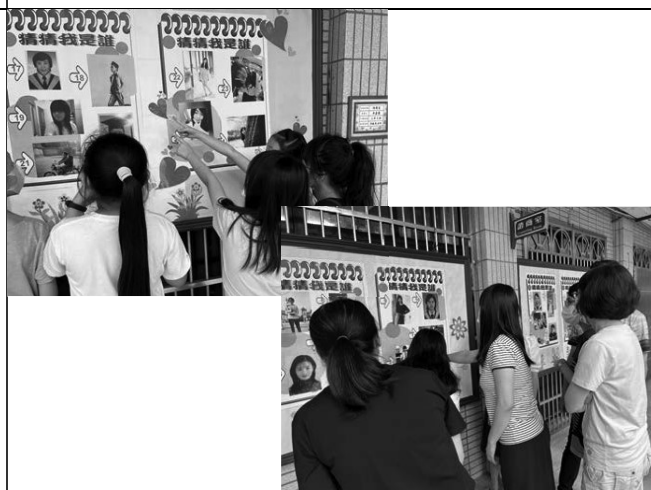
111 年教師節敬師活動，輔導室舉辦「猜猜我是誰」，老師們提供大學時期的照片，讓學生們猜猜看這是哪位老師？連老師們在答案揭曉前都忍不住好奇心，活動趣味十足，也藉由此活動讓學生傳達對師長感謝之意，學習「感恩」的生命教育課題。