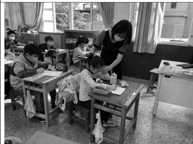
說明：教師協助學生寫學習單。