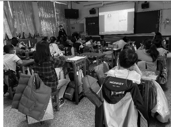
說明：邊閱讀繪本邊寫學習單。