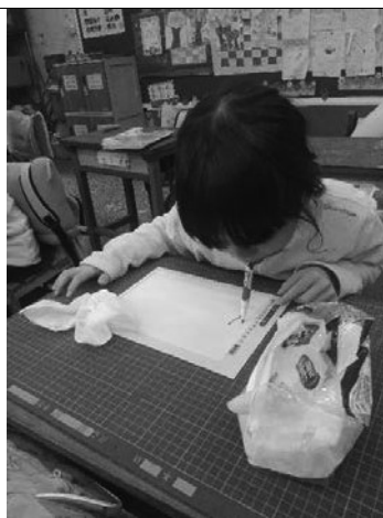
說明：體驗用嘴巴寫字。