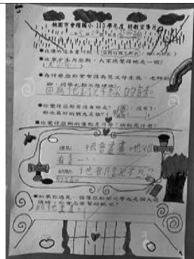
說明：學習單成果展示。