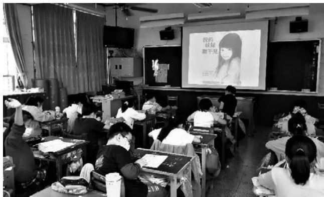
說明：大家一起看繪本。