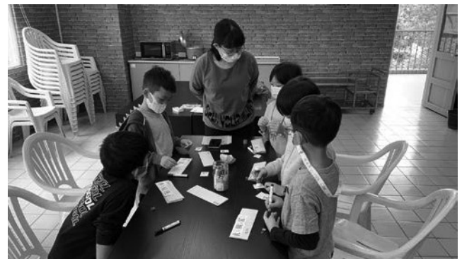
愛自己-專輔教師進行小團體，教導人際互動、自我肯定。