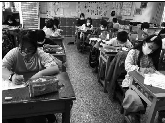
說明：大家都專注寫學習單。