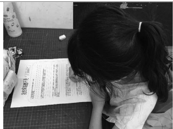
說明：很投入在完成學習單上呢！