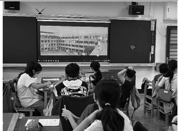
說明：觀看呼叫少年微電影。