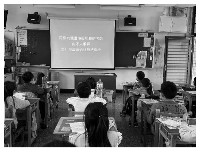
說明：觀看心中的小星星。