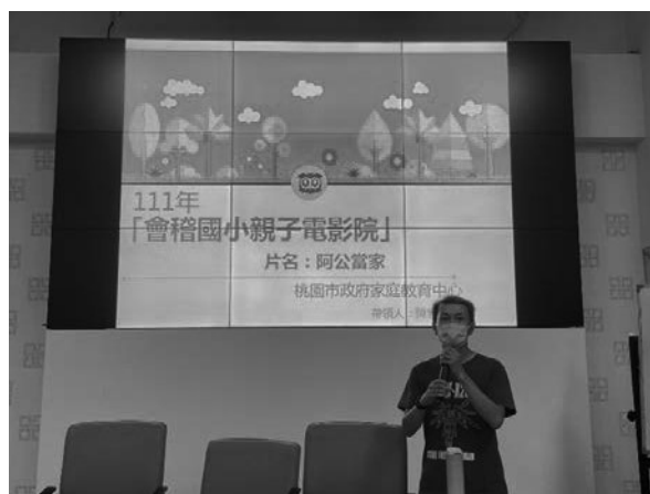
照片說明：看電影談親子溝通活動