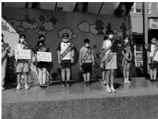
照片說明：晨會進行教師節敬師小語活動