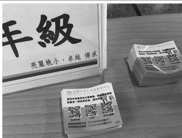
111 學年度辦理親職講座，向家長宣導並發送「家庭教育資源 QRcode 貼紙」提供家長在親職教養上建議與方法，宣揚家庭與生命教育議題。