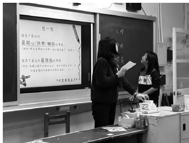
111 學年度專輔教師進行高年級生命教育之情緒與人際關係之入班輔導，帶領高年其學生討論自己情緒的變化及原因，重新認識自己、了解自己。