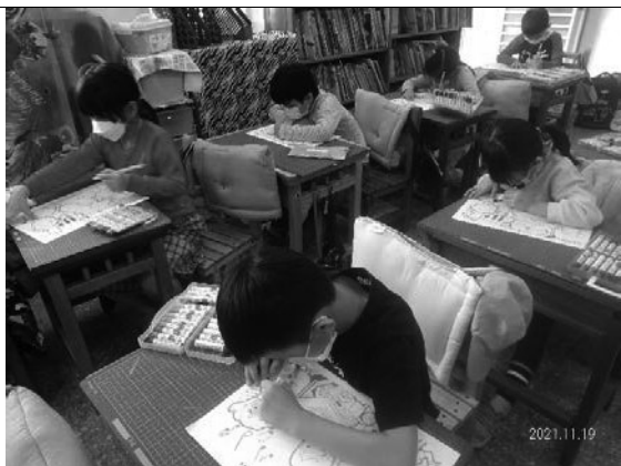
說明：大家都很專心著色。