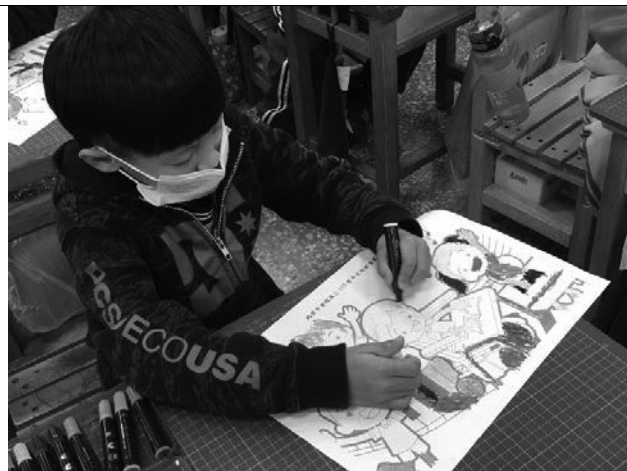
說明：非慣用手畫圖不好畫呢！