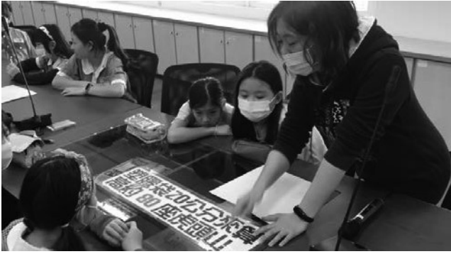
愛環境-珍惜資源課程，生活減塑，環境永續。