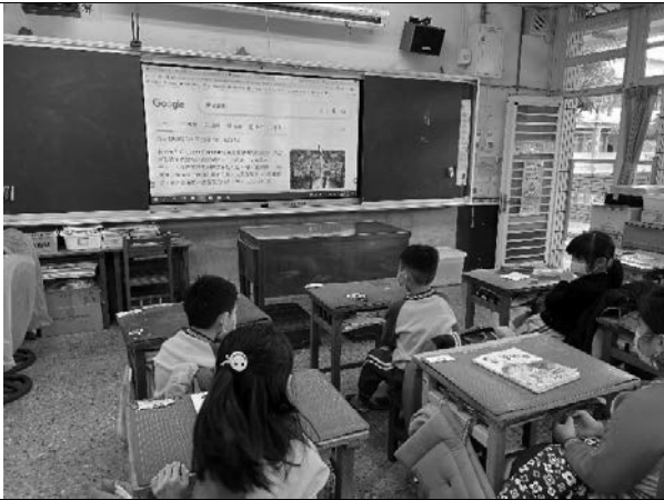
說明：教師補充視障畫家資料。