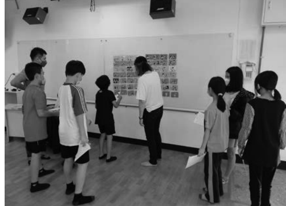
照片說明：專輔老師情感教育-認識情感、接納自我。