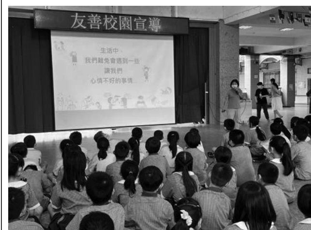
生命教育-遇到傷心難過的事,我們可以怎麼做。