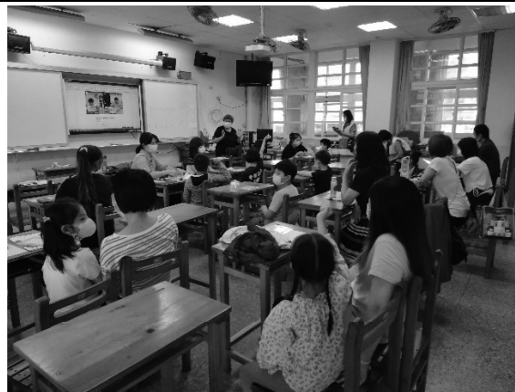
照片說明：認識祖父母的生命歷程與分享