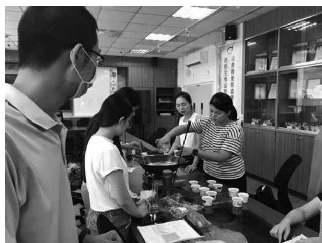
生命教育-心理健康議題討論。