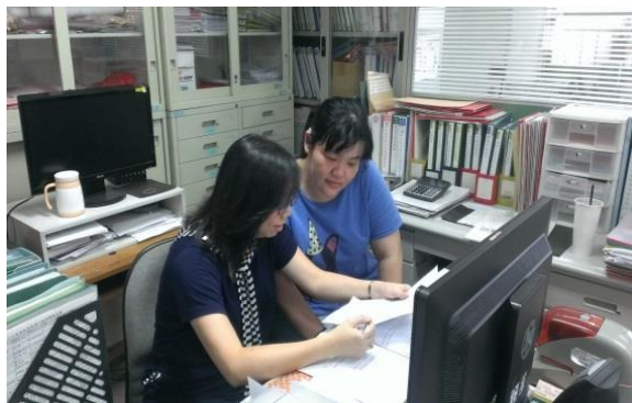
文書組公文系統教學及資料歸檔