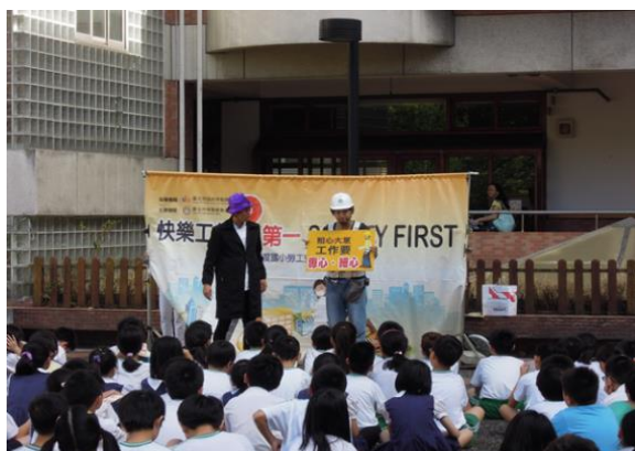
辦理全校學生勞工安全衛生宣導