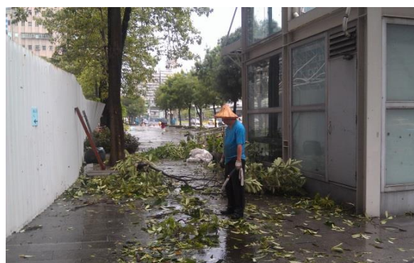
災後清理校園周邊樹枝及落葉