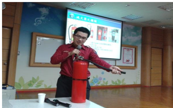
辦理校內防護團研習