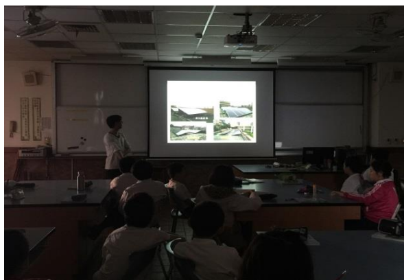
結合校內設置的太陽能板融入自然科教學