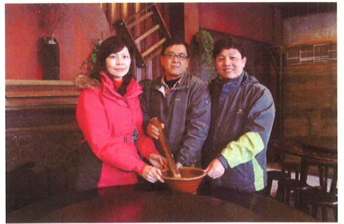
志工開心合影/校長與會長、會長夫人合力擂茶