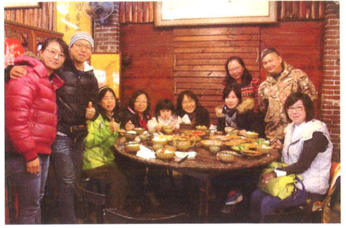
新竹北埔老頭擺享用美味午餐