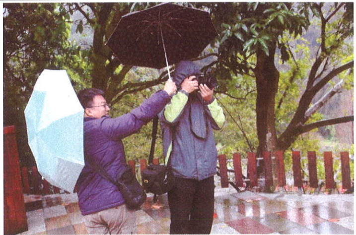
好友出遊超開心/校長幫志工們拍照