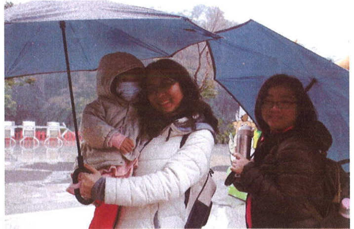
雖是滂沱大雨的天氣. 大家仍玩得開心