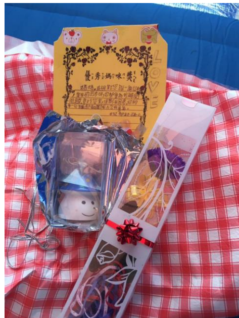
照片說明：在母親節當天，獻上對母親及對家人的祝福與感謝。