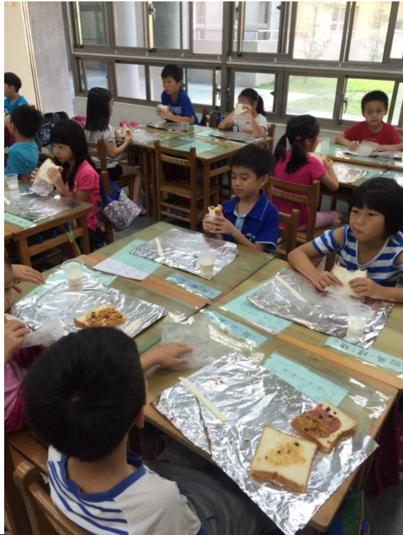
照片說明：終於做好了，開動囉！