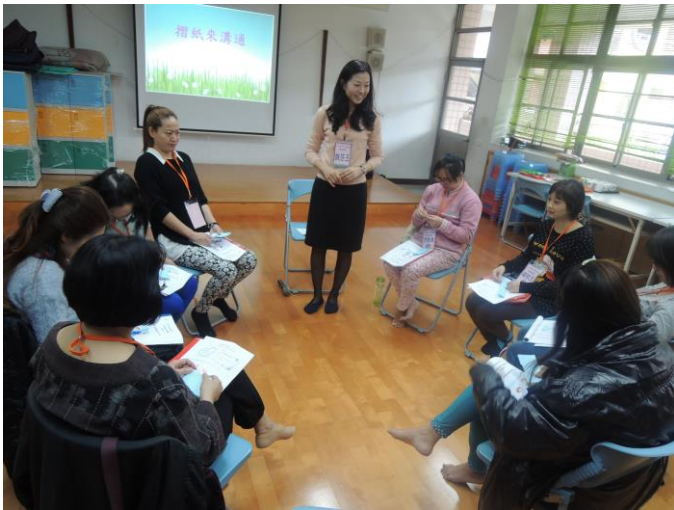
說明： 104 學年度下學期幸福甜甜圈活動照片