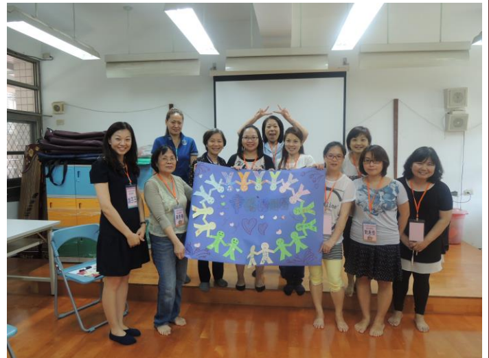
說明： 104 學年度下學期幸福甜甜圈活動照片