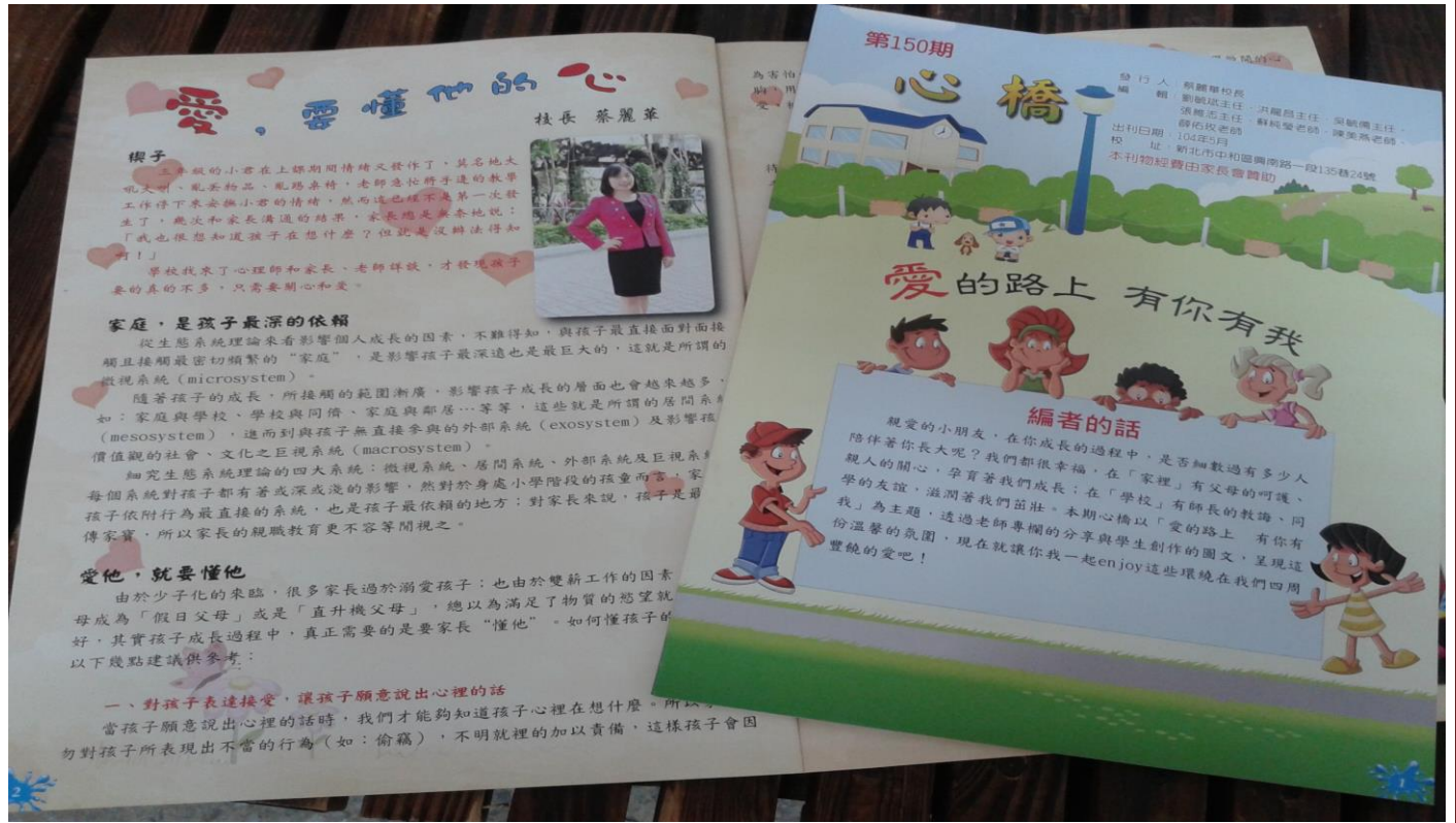
說明：利用本校輔導刊物心橋宣導家庭教育。