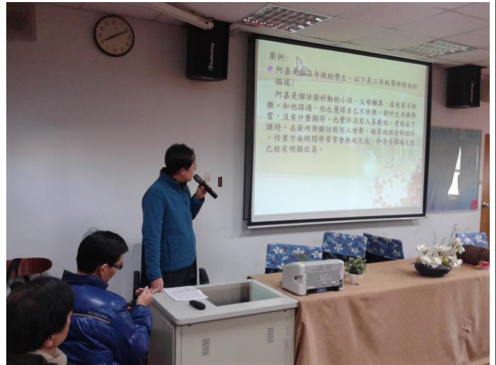
說明： 104 年度家庭教育研習活動照片