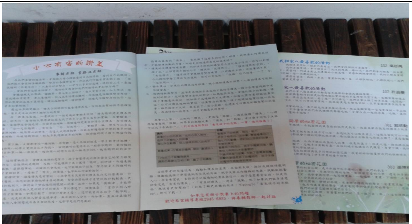
說明：利用本校輔導刊物心橋宣導家庭教育