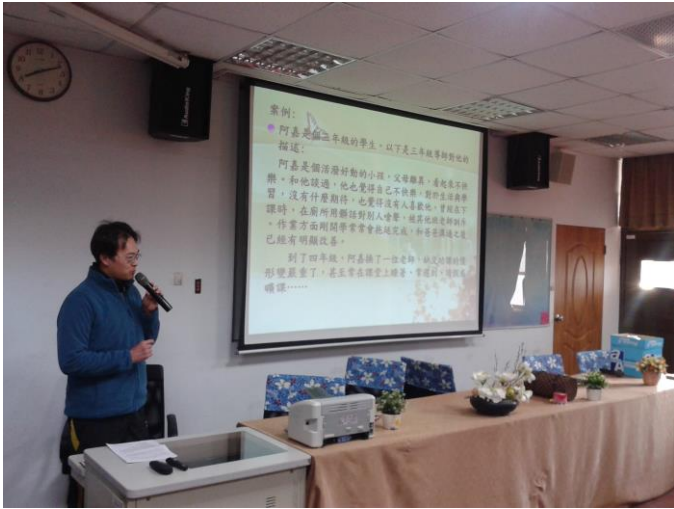
說明： 104 年度家庭教育研習活動照片