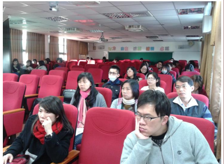
說明： 104 年度家庭教育研習活動照片