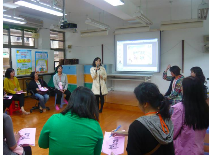
說明： 104 學年度上學期幸福甜甜圈活動照片