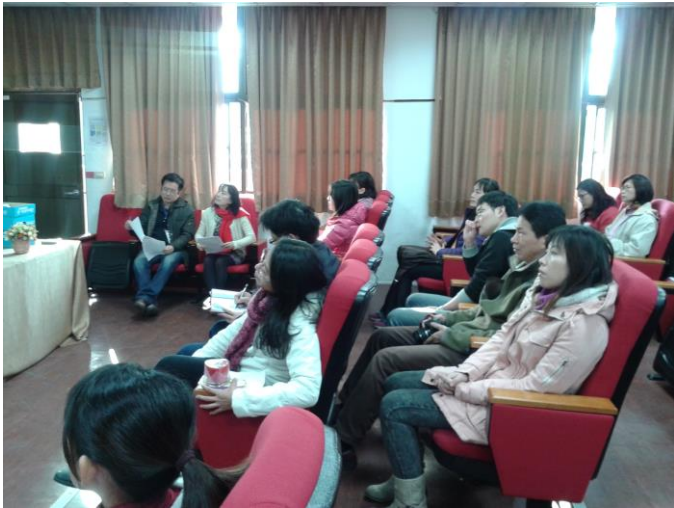
說明： 104 年度家庭教育研習活動照片