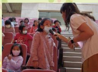
緊張又刺激的有獎徵答