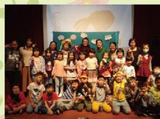
用照片留下美好的回憶吧！