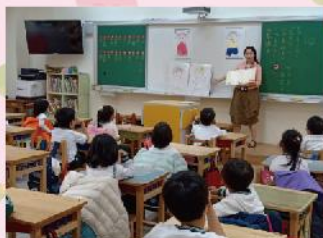
故事媽媽入班說故事