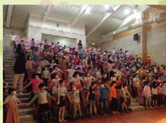
孩子們一同與故事媽媽互動