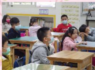
孩子們專注聆聽故事的神情