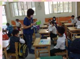
與孩子們熱情的互動