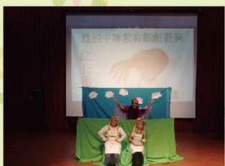
二年級性平宣導：紅公雞

紅公雞也會孵蛋？這次的宣導讓小朋友以開放性的角度思考，照顧家庭、小孩一定是媽媽的工作嗎？故事媽媽以擬人化的大公雞為主角，用戲劇方式表達父兼母職的角色，打破傳統的性別刻板印象，說明兩性沒有絕對的分工原則，也告訴孩子家事不分男女，大家應該彼此體諒分工，共同為家庭付出。