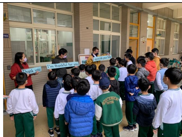
說明 英語充滿在校園角