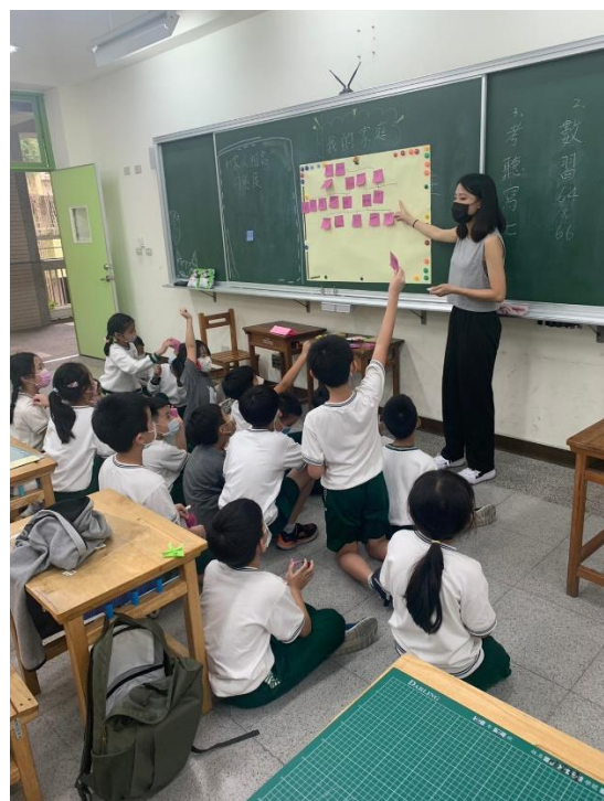
01 複習家庭成員稱位