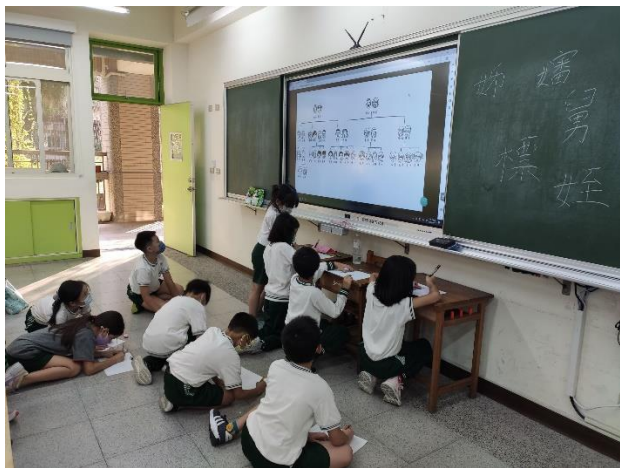
03 完成家庭教育學習單