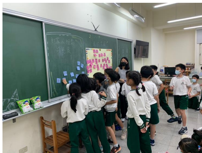
02 學生分享優良的相處態度