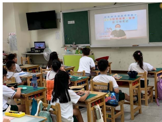
說明 學生透過影片認識友善校園的觀念