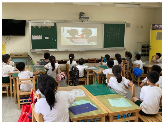
01 說明：紫絲帶影片「達達的超能力」認識什麼是家庭暴力。