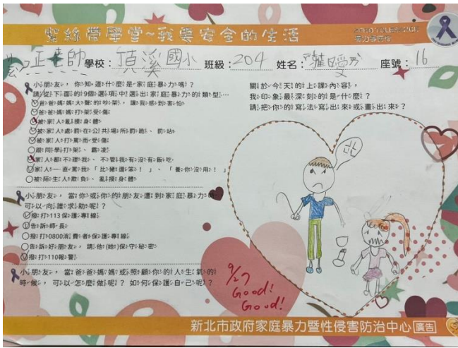
05 說明：紫絲帶學習單成果 02