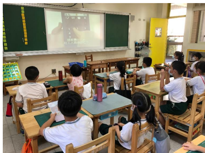
02 說明：紫絲帶影片「達達的超能力」了解家庭暴力的求救方式。