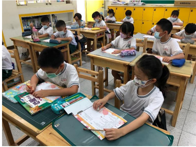
03 說明：全班討論後學生完成學習單。