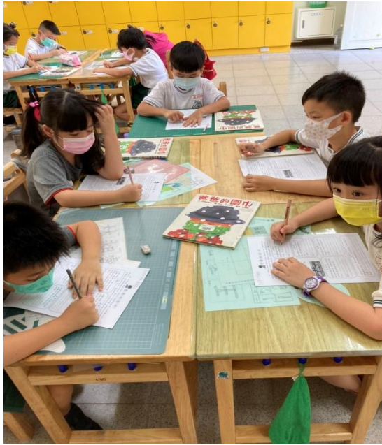
03 完成「爸爸的圍巾」學習單。