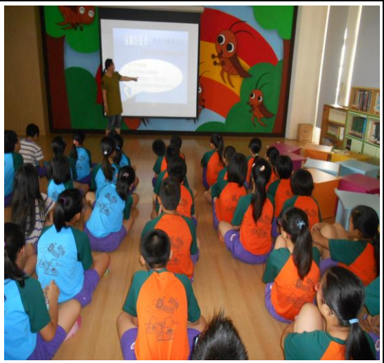
性教育 [愛滋病防治] 宣導