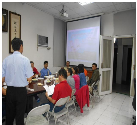
班親會、家長會宣導