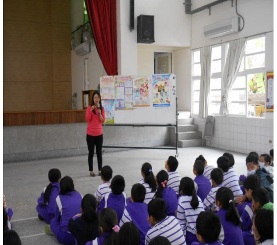
新化衛生所愛滋病防制宣導活動