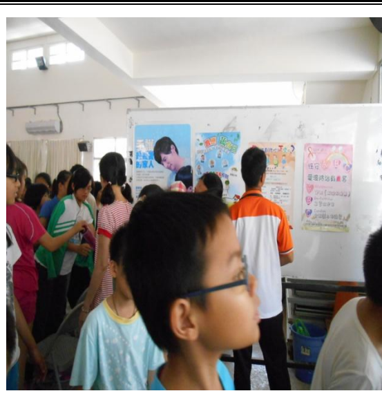
校園廊道或活動海報宣導