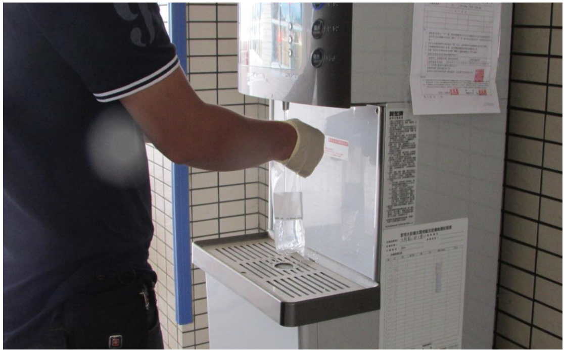
廠商進行水質檢驗取水採樣