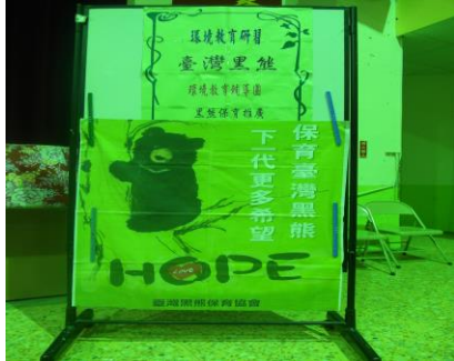
臺灣黑熊文宣海報