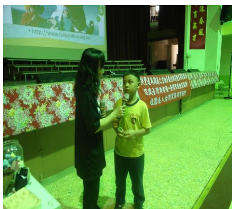
同學回答講師問題