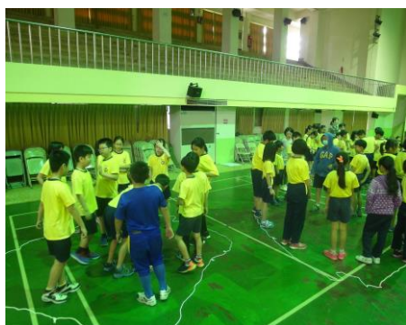
同學們分組玩遊戲