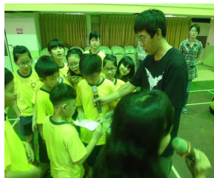
同學們分組玩遊戲回答問題