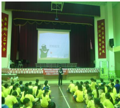
講師介紹臺灣黑熊