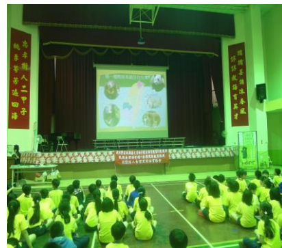
同學們專心觀賞影片