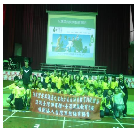
班級師生與講師們合影