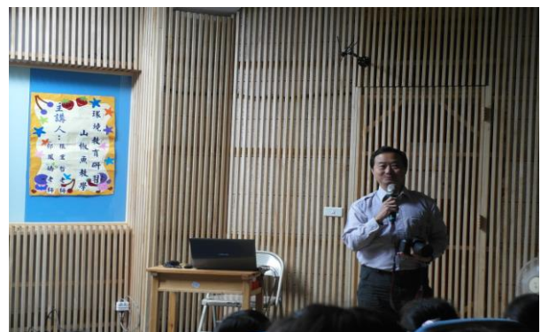
助教提出問題發問