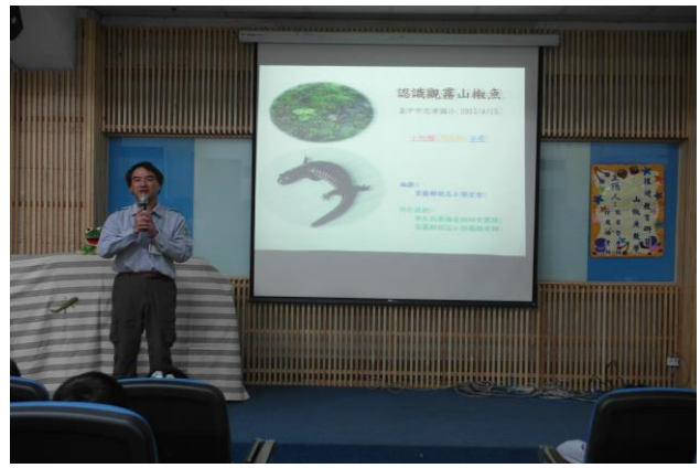
講師介紹山椒魚種類