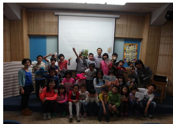
班級師生和講師群合影