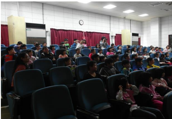
小朋友們專心聆聽之一