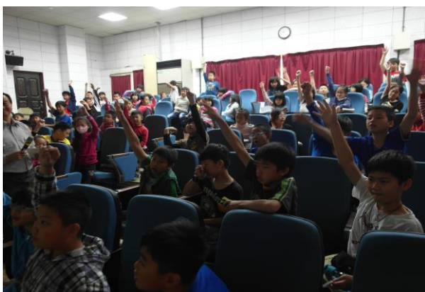
小朋友們熱烈搶答