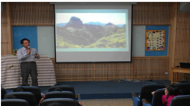
講師介紹雪霸國家公園的景觀