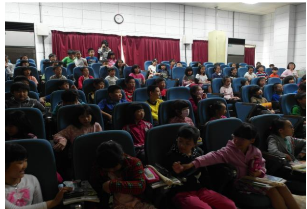
小朋友們專心聆聽之二