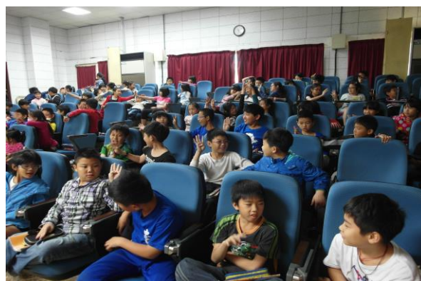
小朋友們融入活動很開心