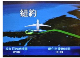
Oh my god! It's New York!!