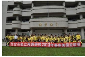
New York! Here we go!