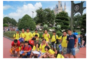
WE LOVE DISNEY LAND!