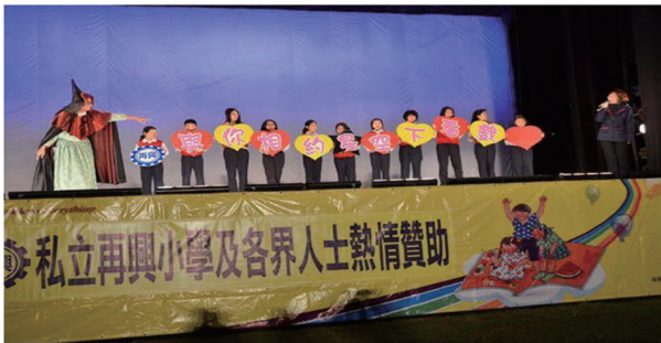
再興師生與南澳鄉孩子相約星空下看戲，共度感動難忘的一夜。

就在放寒假第一天，私立再興小學的孩子們完成了一份特別的寒假作業—圍了微夢想，在星空下看戲之約。20日的夜晚，在宜蘭南澳鄉體育場，再興師生與南澳鄉孩子相約星空下看戲，共度感動難忘的一夜。