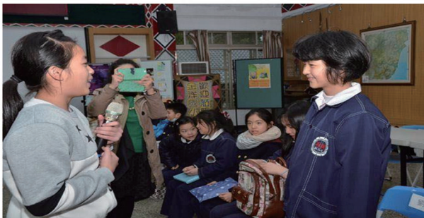
一年前，再興小學微夢想團隊成立，啟動自己一個愛與分享的微夢想。

20日這天儘管天氣嚴寒，細雨綿綿，但絲毫未減大家期待的心情，再興微夢想團隊師生在結業式一結束，立即從臺北驅車前往南澳；南澳的小朋友知道演出消息，金洋國小全校師生放學後再回學校集合統一搭車到會場，還有澳花國小五年級的孩子相約自行搭火車，從和平趕來南澳觀戲，相隔異地的孩子在此交會，一同體驗美好的表演盛會。南澳鄉的薛鄉長非常感謝再興小學全體師生對這場演出的贊助，更表示：施比受更為有福，希望南澳的孩子們有一天也可以貢獻自己的所長！再興小學楊衍校長則感謝紙風車和南澳鄉讓再興師生學會分享擁有。