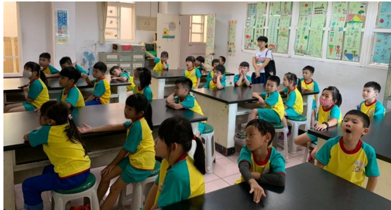
午餐進餐注意事項，及有獎徵答，孩子互動踴躍。