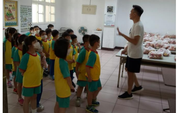
三樓水果及乳品袋置放區介紹。