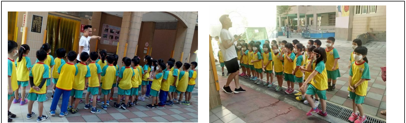
於廚房門口進行簡介，並發放拋棄式口罩。