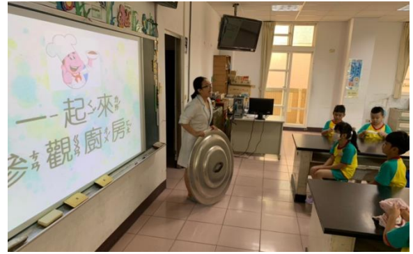
營養師介紹廚房工作流程及午餐相關事項。