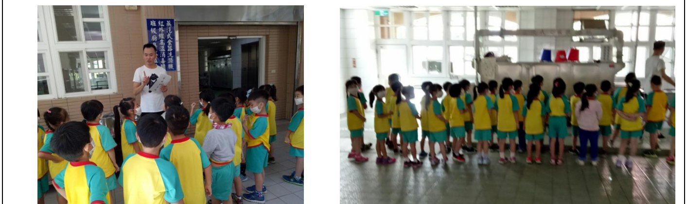
二樓清洗消毒區參觀並說明不能碰觸餐車，並介紹洗碗機工作程序。