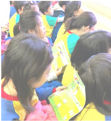
學生認真閱讀宣導單張。