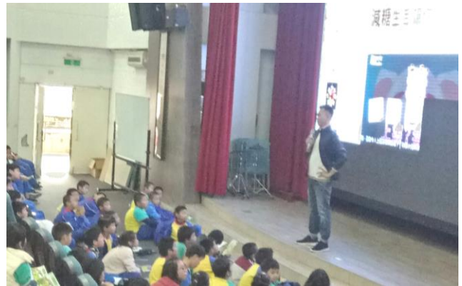
午餐秘書主持講座開場。