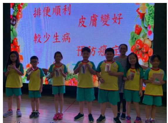
午秘上課實況與有獎徵答。