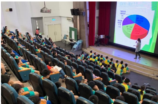
營養師級午秘上課實況。