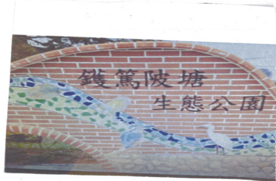
照片說明【 生態內容介紹 】