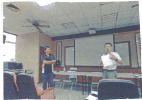
照片說明【 研習上課 】