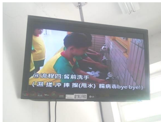
各班利用課餘時間，於開學前兩週期間向學生集 體宣導午餐注意事項。