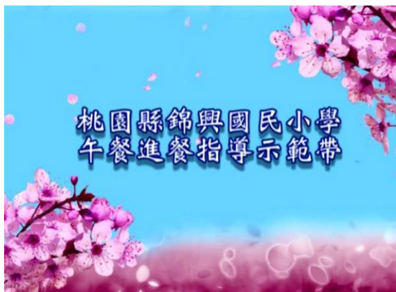
本校午餐團隊自製的「午餐進餐指導示範帶」 （全長共計約八分鐘）。