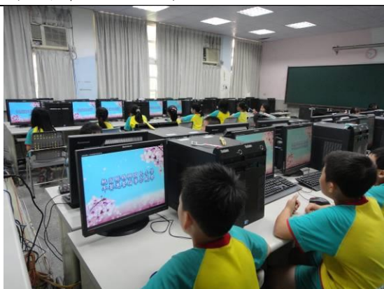
全班於電腦教室觀看示範帶，流程清楚、說明精 確，同學們全神貫注，專心收看。