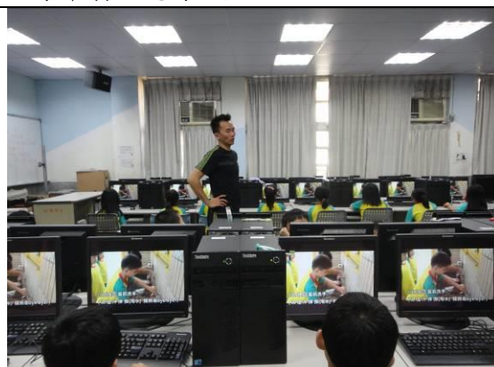
播放過程，搭配老師叮嚀需要多加注意的重點以 加強學生記憶。