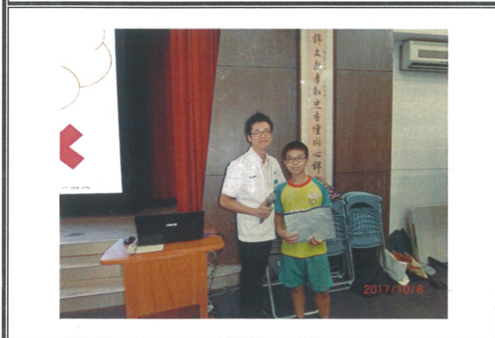
學生參與討論獲得獎品鼓勵