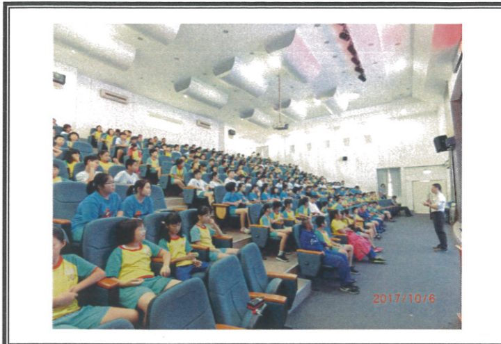
學生專心聆聽講座