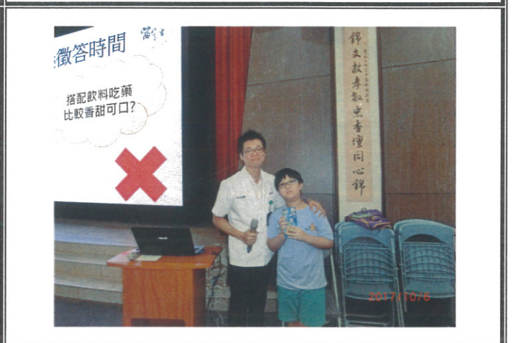
學生熱烈參與問答活動