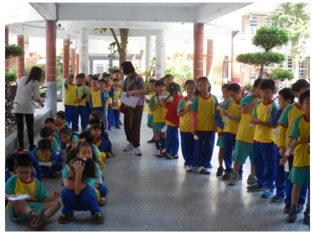
排好隊伍依序做檢查