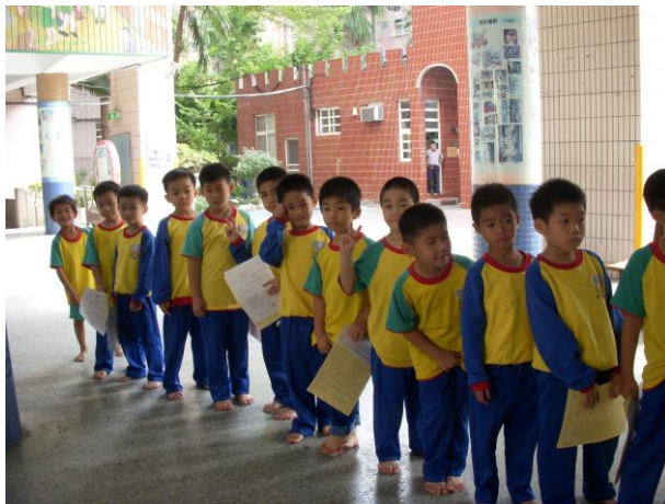
小朋友依序排隊聽護士阿姨說明健康檢查的流程及注意事項