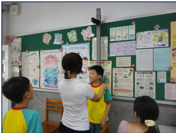
自動化儀器設備讓檢查變得輕鬆又順暢多了