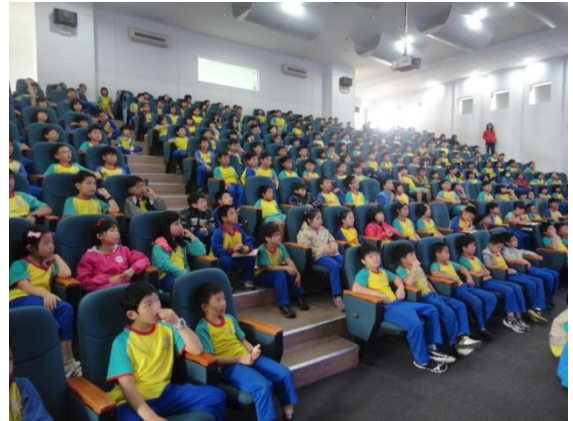
投影片封面與全體三年級學生集合在階梯教室認真聽講。