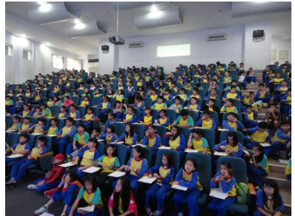
投影片封面與全體五年級學生集合在階梯教室認真聽講。