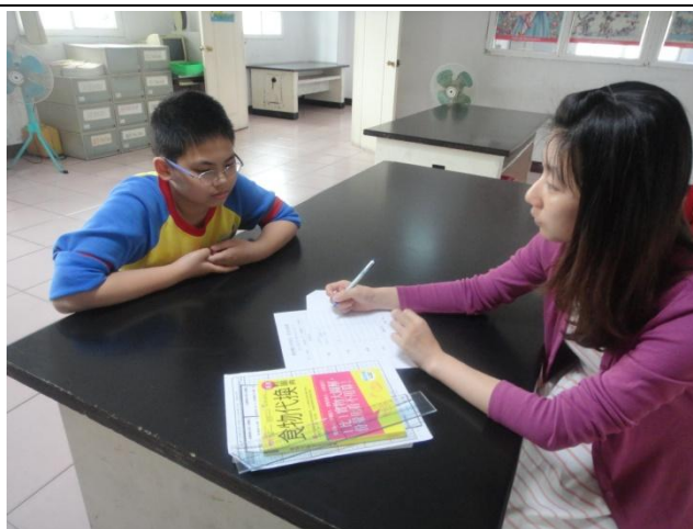
記錄學生回答之飲食狀況，並估算熱量、給予建議。