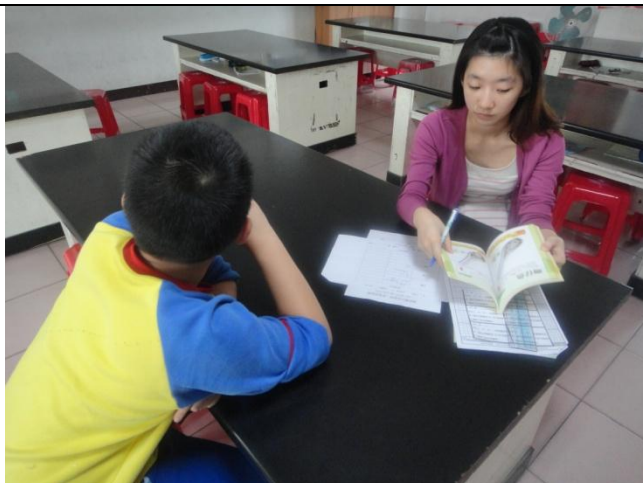
以圖片估算飲食份量。