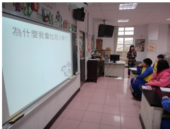
課程講解引發學生學習動力