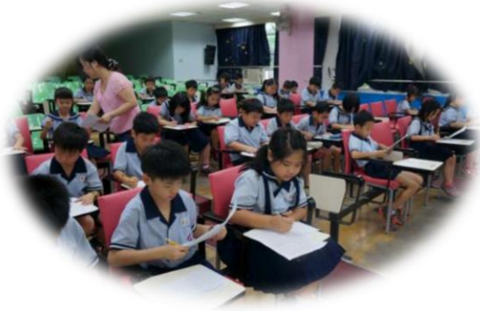
一二年級採紙筆測驗