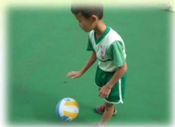
球感—有效的拍球動作