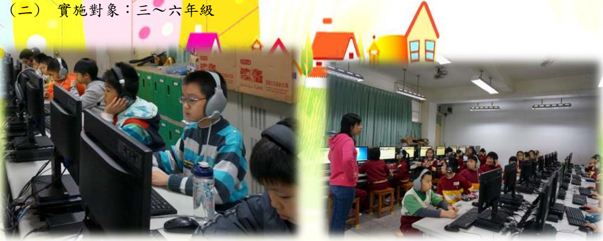
學生專心審題並作答