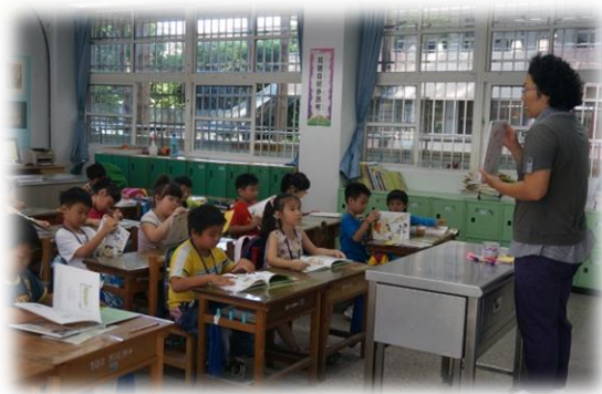
週三推動生師生共讀