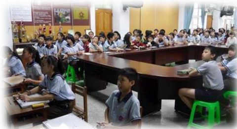
認真審題與答題的學生