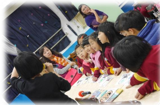
辦理學生與編輯有約