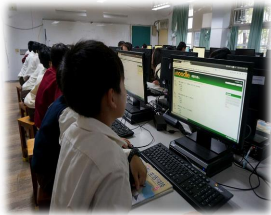
三~六年級採電腦測驗