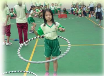
呼拉圈—阿諛的身段