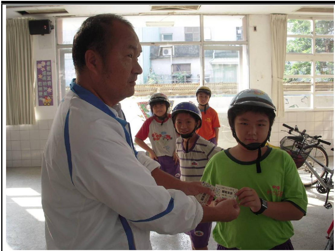
第五關 學務主任核發駕照