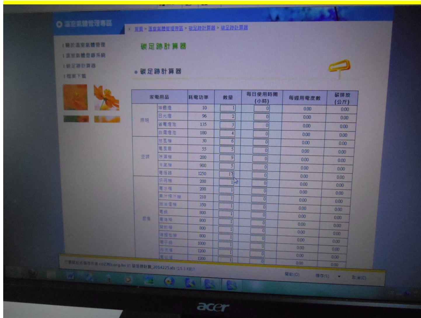
介紹碳足跡計算器如何使用