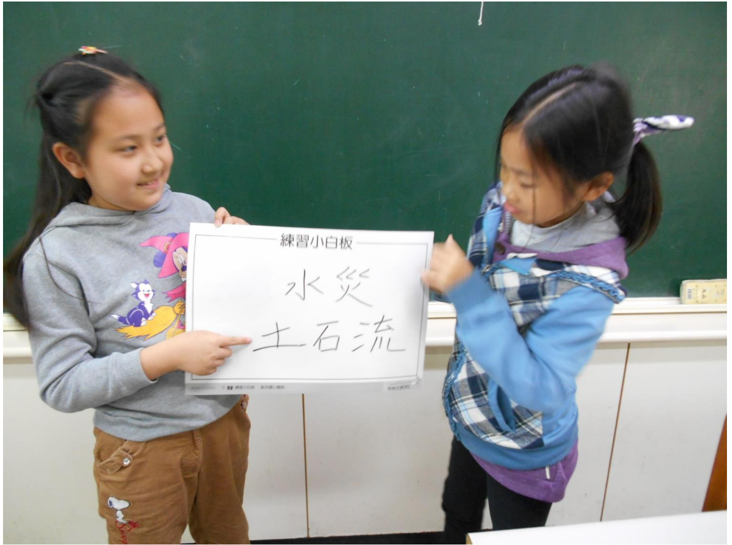
學生分組討論:氣候改變對人類造成的災害.