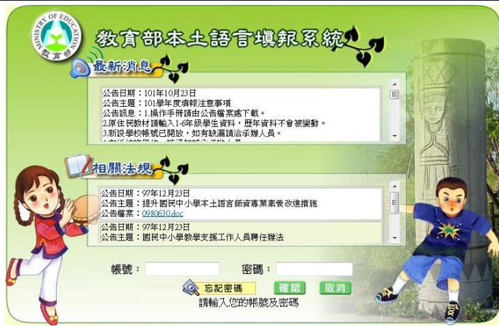
教育部本土語言填報系統