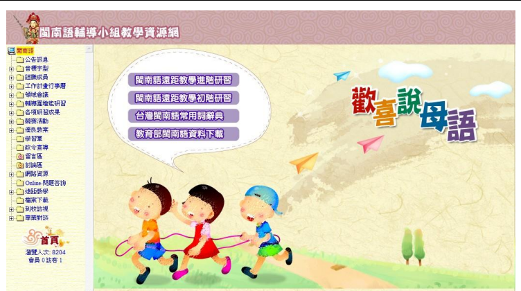
苗栗縣政府閩南語輔導團