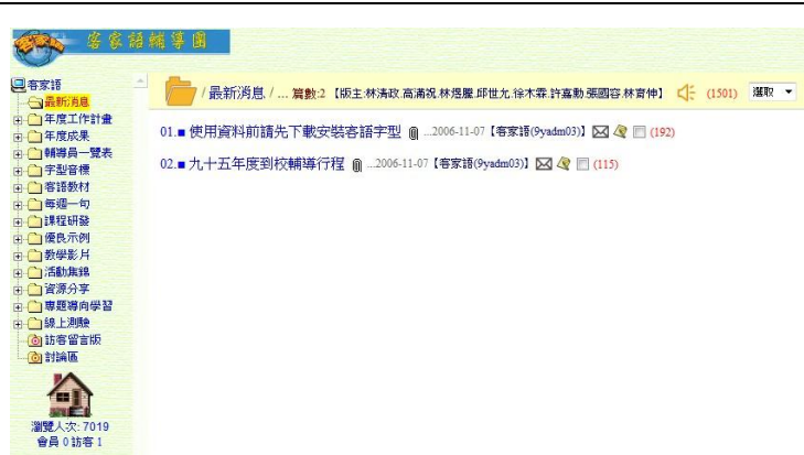
苗栗縣政府客語輔導團