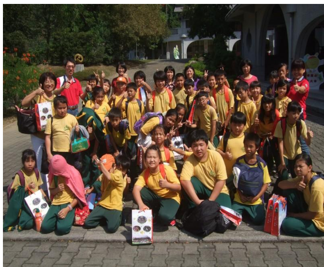
102學年度台中市讀報實驗班——國小 送報時間 102-上學期：日報 102.10.1開始送報→103.1.15—共3.5個月 102-下學期：日報103.2.17開始送報→6.16—共4個月 日報每月費用300元，週刊每期60元