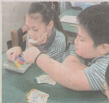
▲玩桌遊時只能說英文。

Round two / Try again 等，都能自然脫口說出。 至於「聽不懂英語組」則到停車場玩賽車遊戲，不用說話，只要「用眼」、「動手」即可。 規畫社區特色景點行程 俄羅斯著名的紅場是世界文化遺產，在臺灣頭份也有個紅磚瓦片的聚落——蘆竹滴古厝，這是至今保存三百年的閩南式傳統建築。學生規畫「體驗臺灣古早味」的日常生活動，期盼小客人可以感受到溫暖且濃厚的人情味。