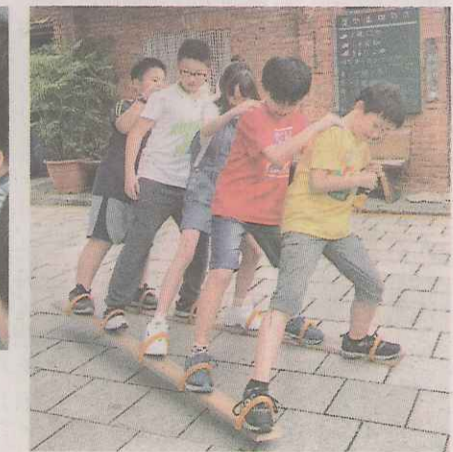
▶在三合院庭埕玩蜈蚣競走。

大地遊戲與室內的桌遊活動，並安排小客人住宿小 組成員家裡。為使活動進行順利，預想俄羅斯小客人會說英文及不會說英文的兩種情境。小組找了班上兩名英語能力佳、兩名英文待加強的同學協助，「聽說英語組」玩桌遊「