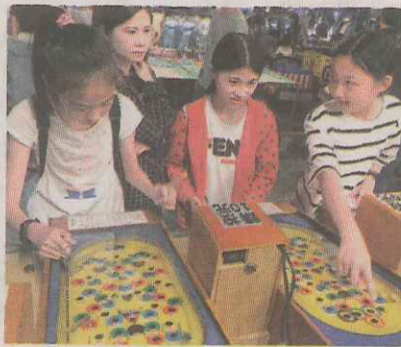
▲到夜市考察，玩打彈珠和套圈圈。