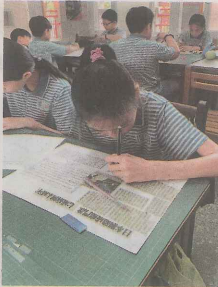
◀讀報後，製作跟日本相關的國際新聞剪報。