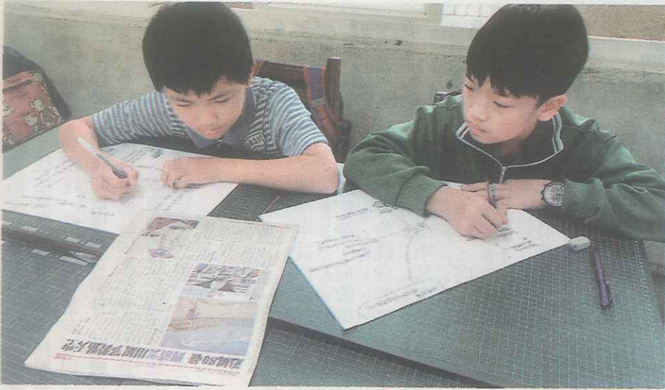
◀讀報後畫出人物報導的心智圖。