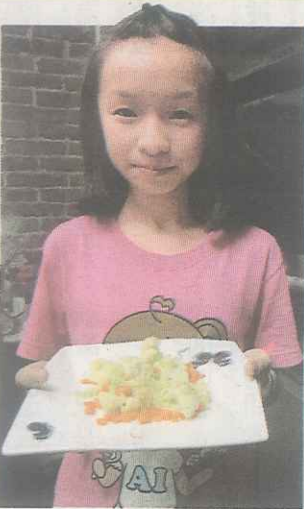
▲奶油香菇炒花椰菜上菜咯！

苗栗縣照南國小教師，讓學生在寒假期間化身新聞工作者，以A3紙張大小當作一個版面，規畫專題報導、寒假書房、專訪人物，以及生活記趣四個版面。學生必須構思個人報紙的名稱、刊頭設計，可以手繪製作或電腦排版彩色列印。