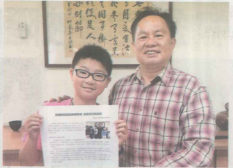
◀專訪校長的報導完成了。