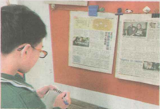
▲做筆記，摘錄採訪技巧。