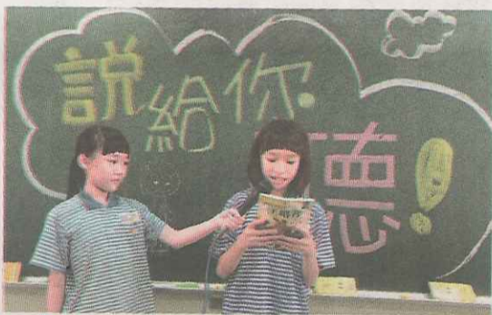
▲上臺報告讀書心得。