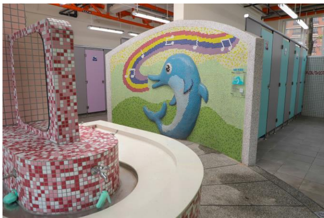
1樓海豚廁所主牆面