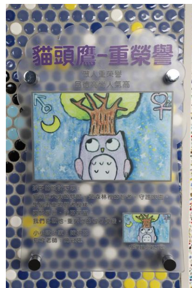
各樓層搭配介紹圖文，嵌入學生設計作品展示