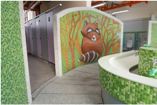
4樓浣熊廁所主牆面