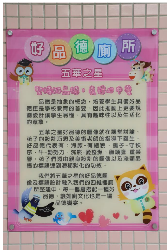
各樓層廁所內部搭配每層樓柱子的顏色配色