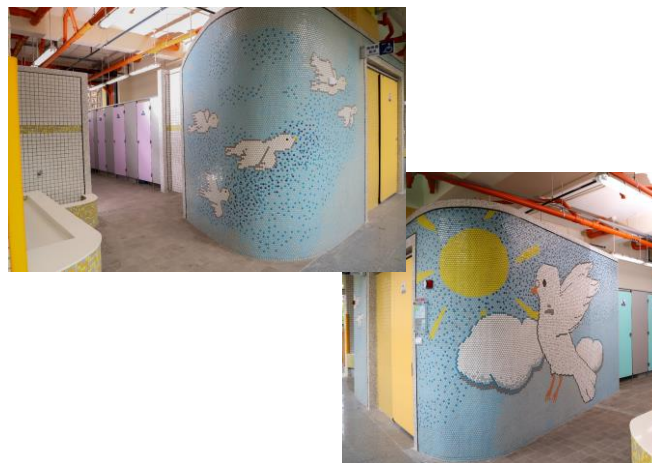
2樓鴿子廁所主牆面