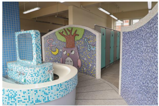
5樓貓頭鷹廁所主牆面