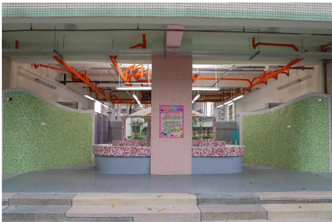
寬敞、明亮、配色柔和新穎、搭配獨一無二的五華之星好品德圖像