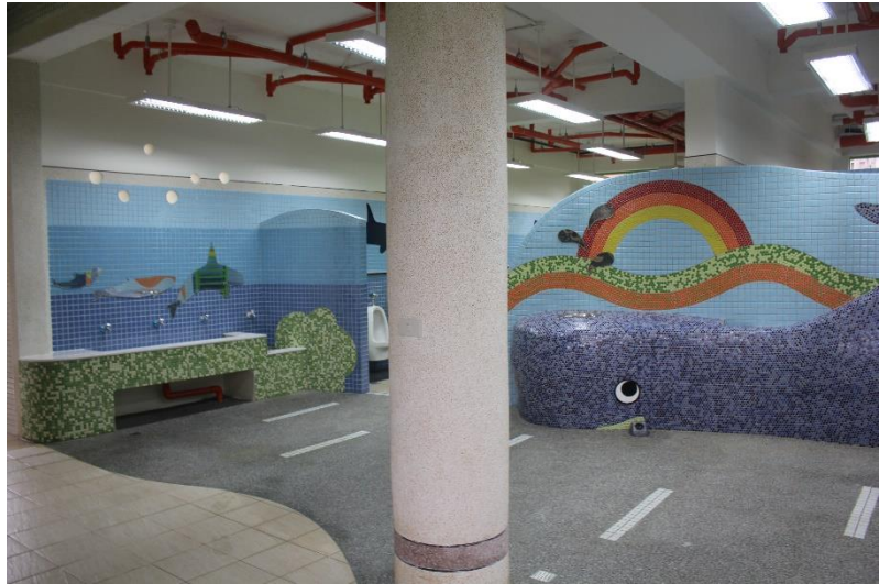
饒富童趣的 鯨魚噴水洗手台