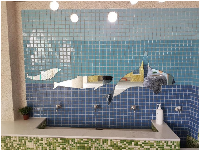
鏡子以及牆上的 魚類造型剪影