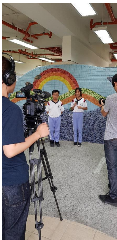
學生進行介紹並接受採訪