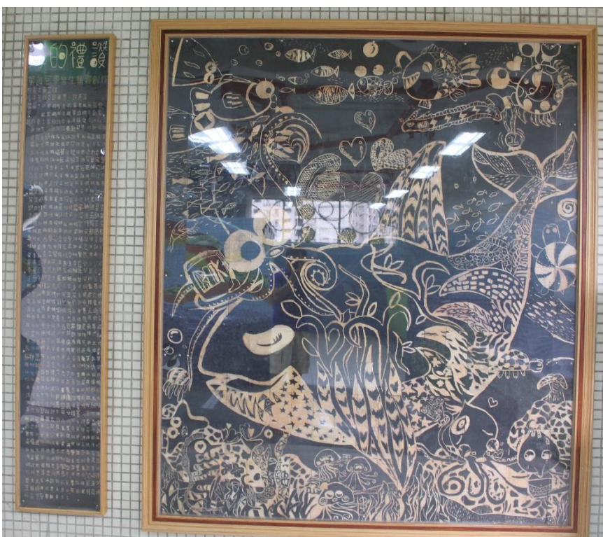
學生的集體創作 作品牆面