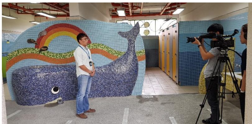
主任說明 設計發想並接受採訪