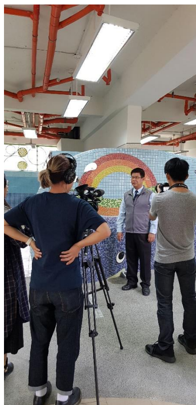
校長介紹鯨魚廁所特色並接受採訪