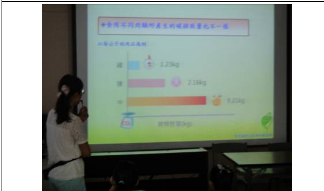
照片說明：宣導減碳蔬食對環境與健康的意義