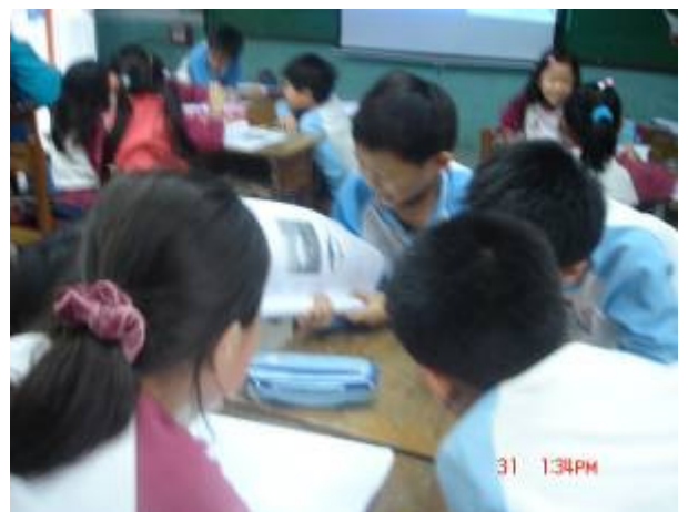
小朋友分組討論鮪魚和人類的關係