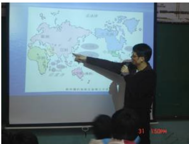
說明鮪魚的分布圖