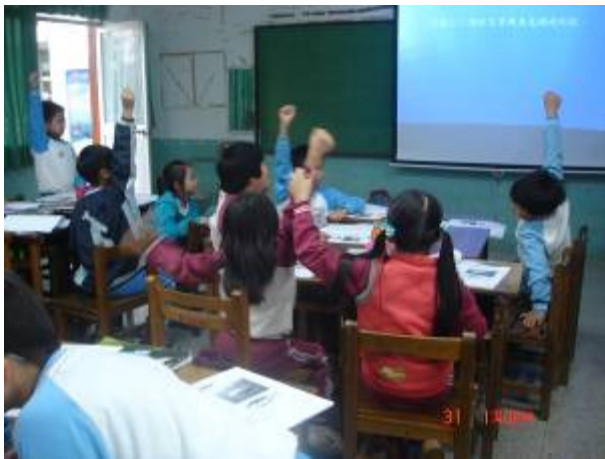
學生踴躍發表鮪魚的外形特徵