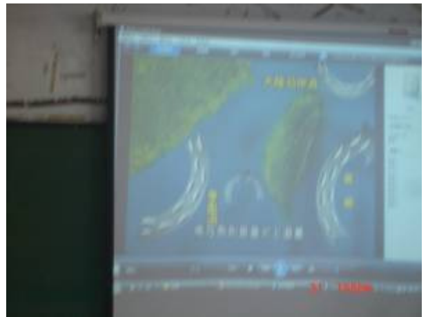
觀賞鮪魚洄游路線 DVD