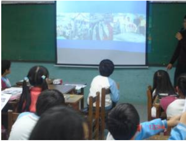
黑鮪魚文化觀光季活動介紹