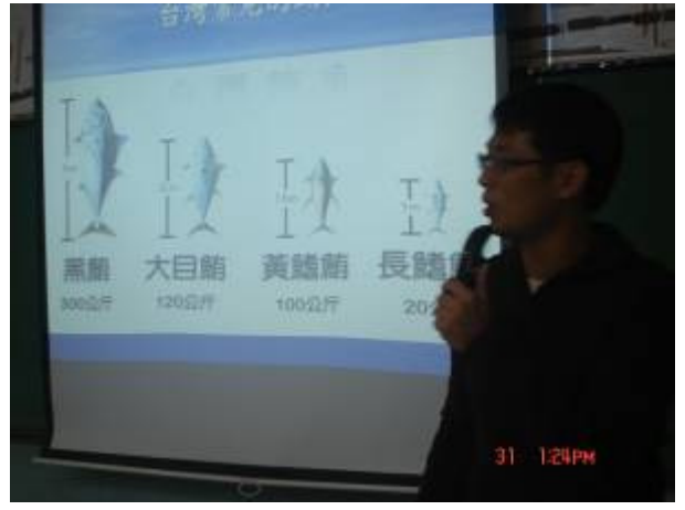
台灣常見鮪魚種類介紹