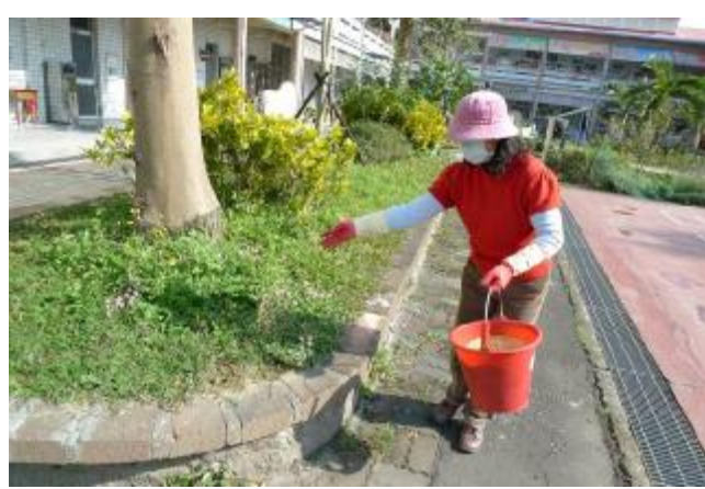
物質環境：紅火蟻投藥，營造安全校園