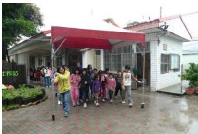
物質環境：設置帳篷雨傘，方便雨天通行