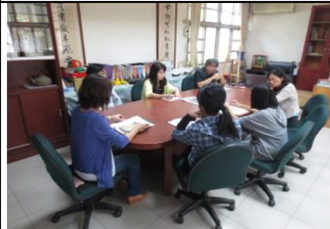
衛生政策：健康促進推動小組會議