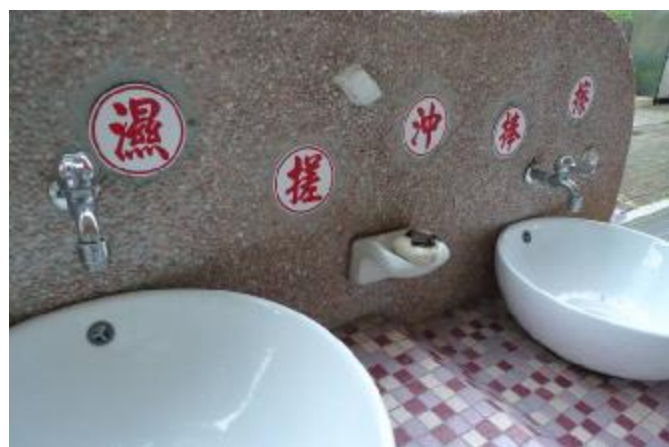
物質環境：張貼洗手順序標語，落實衛生保健