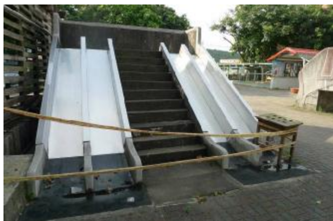
物質環境：維護運動場及遊樂設施安全性