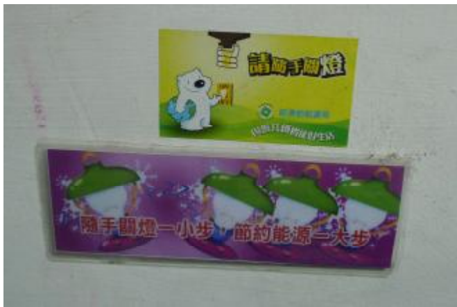
物質環境：推動節約能源，營造永續校園