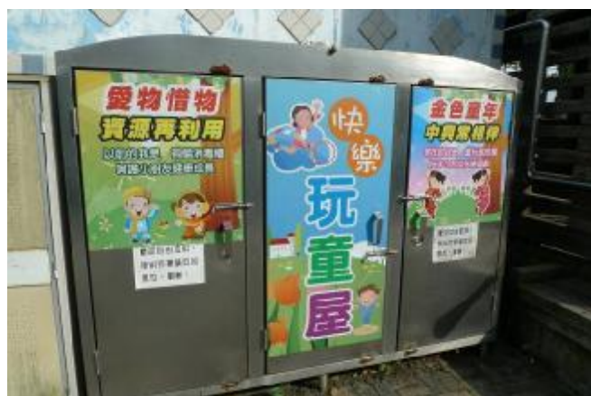
物質環境：建置「快樂玩童屋」，收納童玩