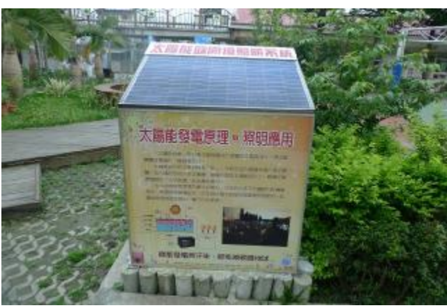
物質環境：建置各式節能設備，營造永續校園