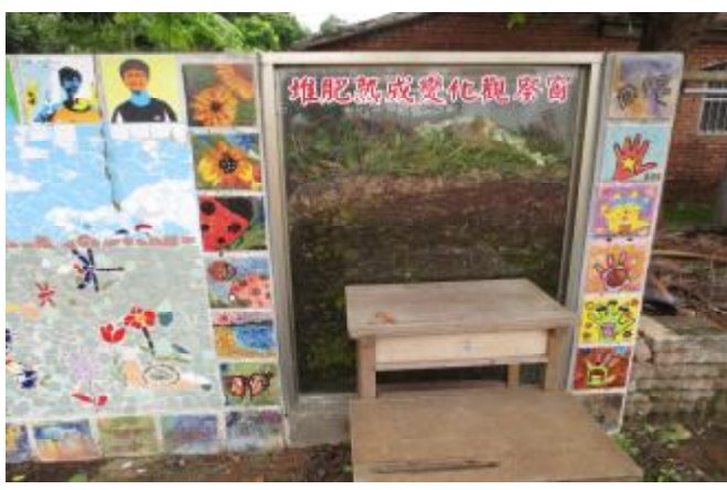
物質環境：推動落葉與廚餘堆肥，營造永續校園