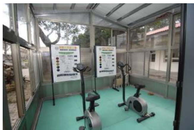
物質環境：設置光電夢工廠，建置發電腳踏車