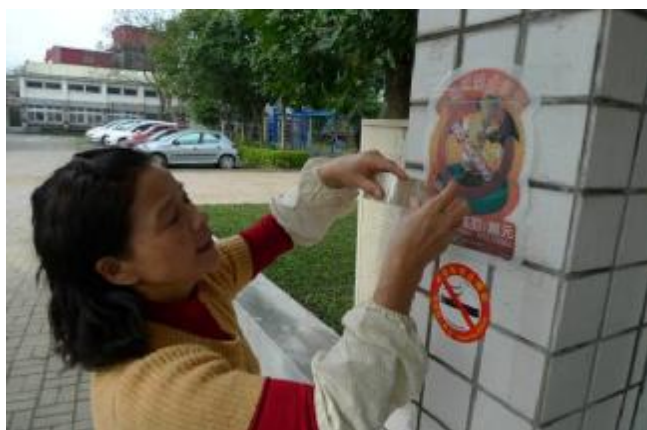
物質環境：張貼反菸標章，表明拒菸態度