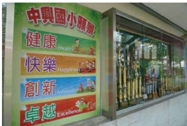
物質環境：張貼願景布條，宣誓健康決心