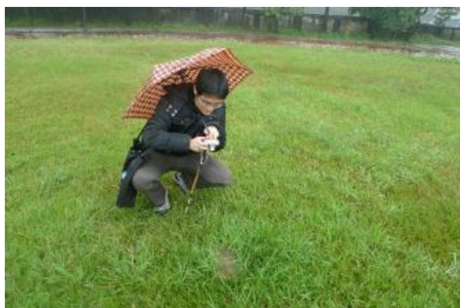
物質環境：紅火蟻輔導團到校，營造安全校園