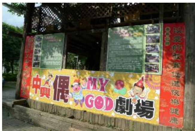
物質環境：「中興偶 MY GOD」戶外課程場地