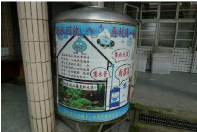
物質環境：建置雨水撲滿，營造永續校園