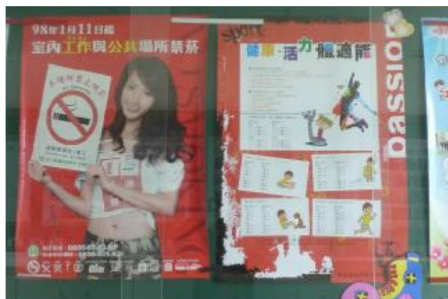
物質環境：校園張貼健康促進相關海報