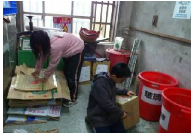
物質環境：推動資源分類，營造永續校園