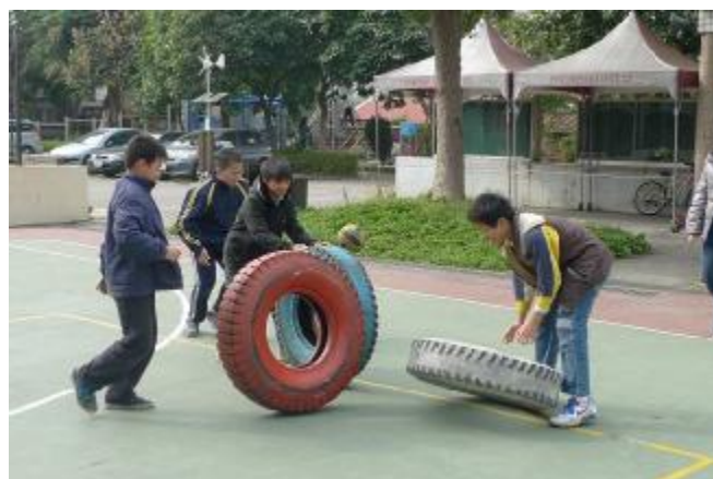
物質環境：安排「時代巨輪」，利用趣味滾輪胎鼓勵運動