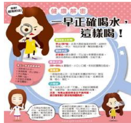
衛生政策：印發宣導單張，提供健康衛生資訊