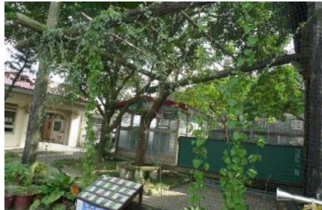
物質環境：校園綠美化作業，營造優質環境