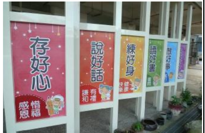
物質環境：設立校園標語，鼓勵健康促進