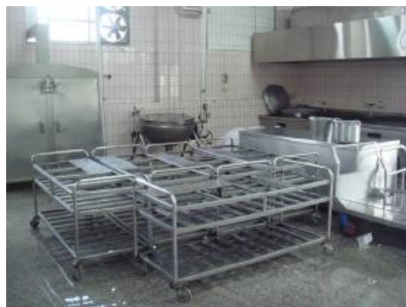
物質環境：充實廚房設備，保障衛生的膳食 (熱水器飯鍋)