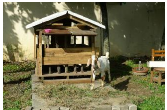
物質環境：活化閒置空間，佈置「可愛動物區」，激發學生下課戶外活動意願