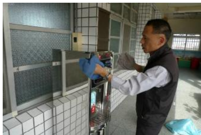
物質環境：定期更換濾心，確保飲水安全