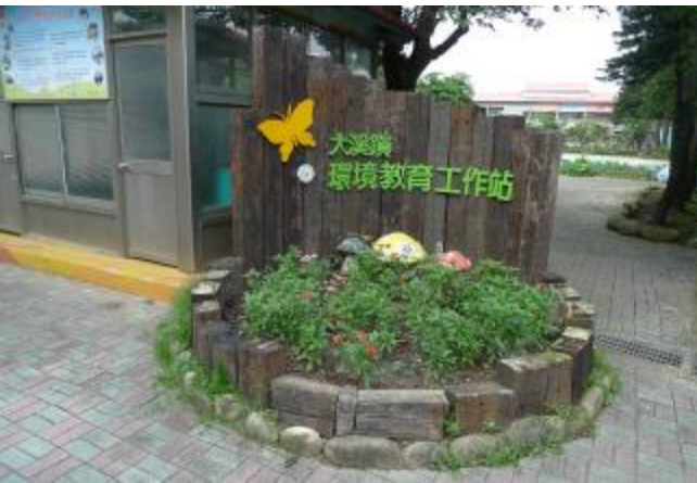
物質環境：建置大溪鎮環境教育工作站