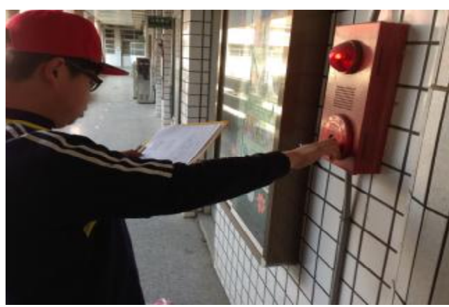
物質環境：檢視消防設備，確認器材狀態