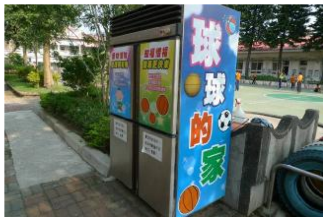
物質環境：規畫「球球的家」，提供下課使用