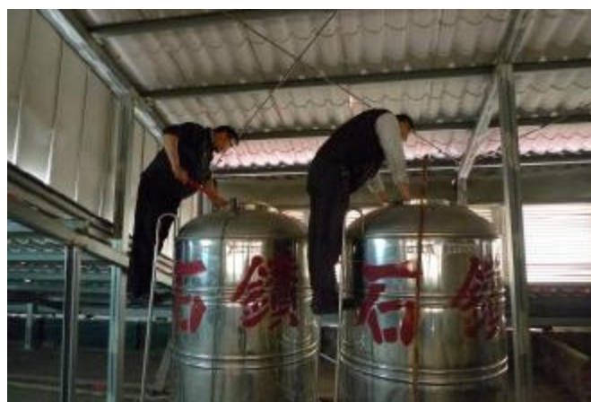
物質環境：定期清洗水塔，確保用水衛生