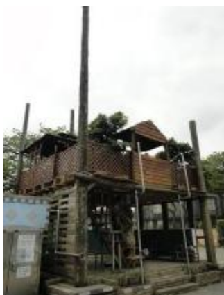
物質環境：規劃樹屋，鼓勵學生走出戶外