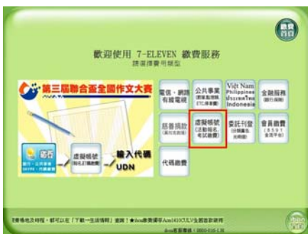
(2) 選擇虛擬帳號（活動報名、考試繳費）